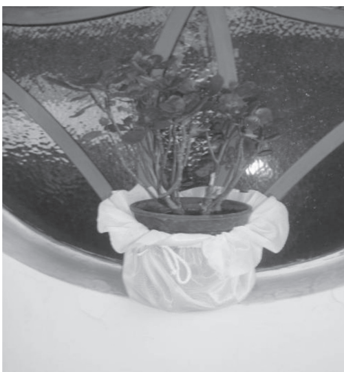
Figura 2 - Vaso de planta protegido com a capa Evidengue® em um domicílio do local do estudo.

Outro fato observado foi a presença de tonéis atestando a ausência de abastecimento de água. Essa situação revela o descaso do poder público em relação aos serviços básicos, como abastecimento de água, um bem de consumo de direito dos moradores, constituindo-se como política pública inserida nos objetivos do milênio (21) . O descumprimento de ações dessa natureza não só compromete a saúde do morador, como amplia a vulnerabilidade do território para a permanência e recrudescência de doenças de controle factível no século XXI (8) .