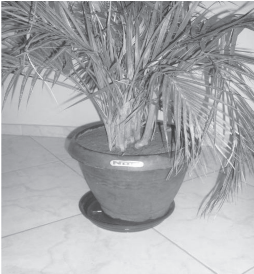
Figura 1 - Vaso de planta desprotegido em um domicílio do local de estudo.

Os achados refletem aspectos relacionados aos modos de vida contemporâneos, recorrentes no meio urbano, marcados pela crescente produção de resíduos não orgânicos, que, se descartados de modo incorreto, podem configurar-se como possíveis criadouros, dificultando o controle do mosquito (8) .