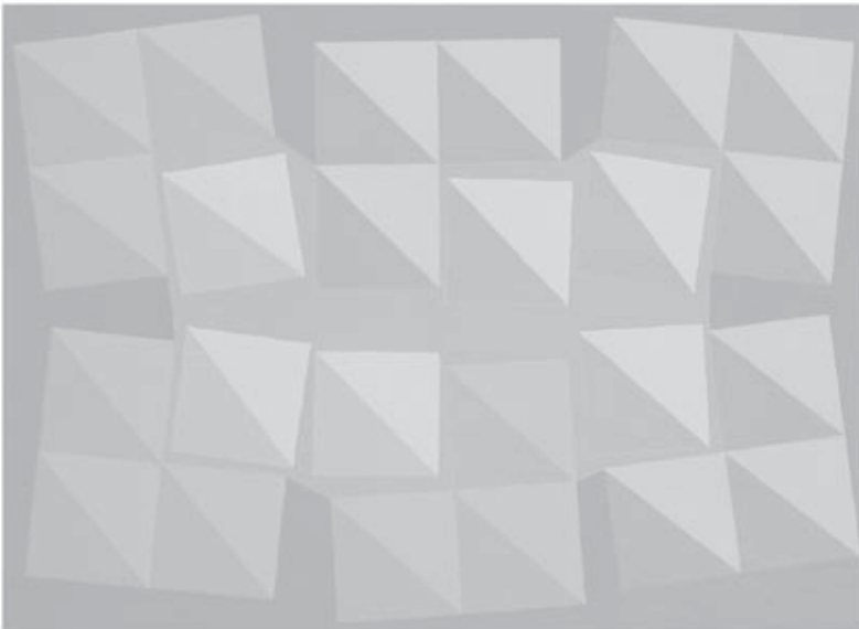
Pintura de Athos Bulcão