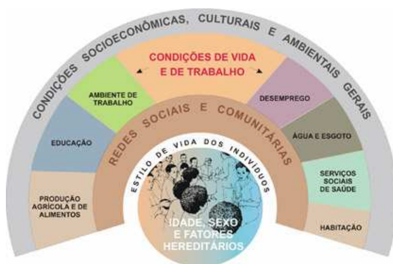
Figura 2 - Modelo proposto por Whitehead e Dahlgren para classificar os determinantes da saúde

O modelo de Whitehead e Dahlgren (Figura 1), demonstra os níveis de atuação sobre os DSS. Classifica os determinantes apontando uma gradação desde os mais gerais, relacionados às estruturas socioeconômicas e culturais de uma sociedade até os determinantes ligados à biologia dos indivíduos