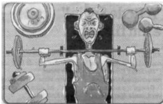
Figura 3 - Músculo fácil, fácil...