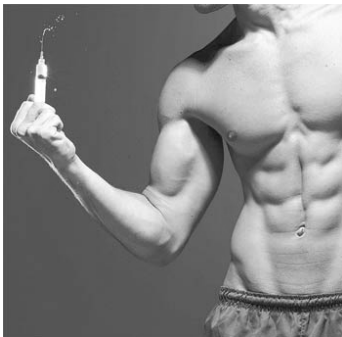
Figura 1: O momento de injetar

No caso do corpo feminino, ele aparece em quatro fotos, sendo duas relativas à mesma reportagem. Os corpos femininos retratados não aparentam musculosidade exacerbada, se comparados aos corpos dos homens, embora estejam realizando “malhação pesada” em três das fotos. Uma delas sugere uma posição mais sexualizada, por meio da projeção da pélvis. Nesse mesmo caminho, da sugestão de sexualidade, há uma reportagem que exhibe a foto de um homem musculoso, do qual não se vê o rosto, empunhando com vigor uma seringa.