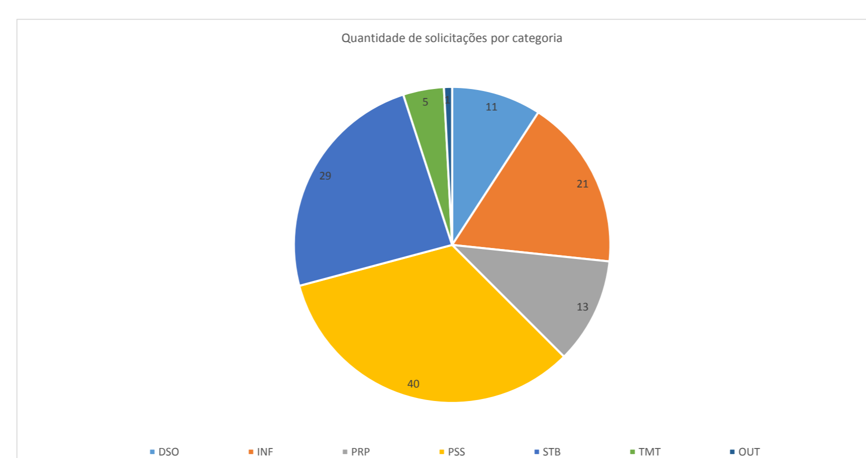
Gráfico 2 – Quantidade de ideias/sugestões por categorias