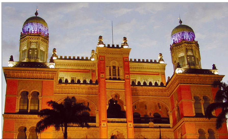
Fundação Oswaldo Cruz Centro de Relações Internacionais em Saúde - CRIS

A próxima reunião da Câmara está prevista para 17 de junho. O encontro vai contar com a apresentação das atividades de cooperação internacional da Escola Politécnica de Saúde Joaquim Venâncio (EPSJV/Fiocruz).