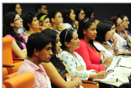
Estudantes recebidos pela Fiocruz durante o evento