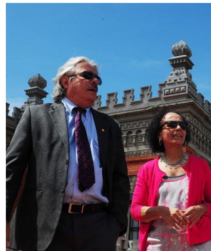
■ A embaixadora da Venezuela no Brasil com o presidente da Fundação, Paulo Gadelha