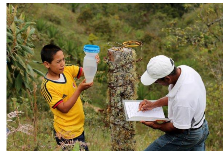
CGIAR Ciência cidadã na adaptação à mudança climática