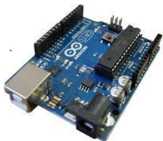
Arduino - plataforma de prototipagem eletrônica