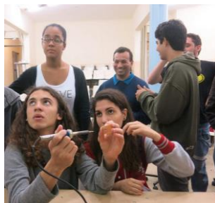
CTA Estação meteorológica modular