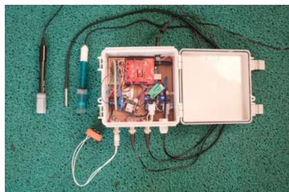
Rede Infoamazônia Projeto Mãe D'Água