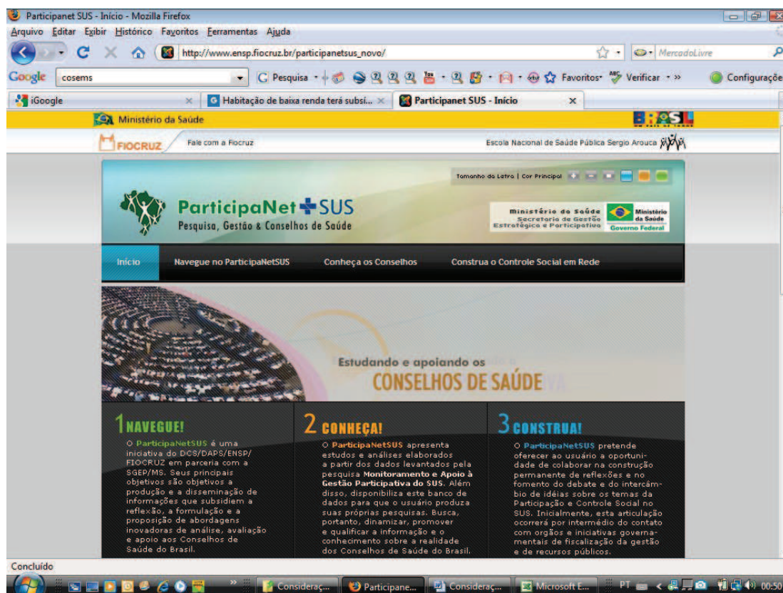
Figura 3 – Página inicial do Portal ParticipaNetSUS

Esta Pesquisa também propiciou a consecução de uma série de produtos que, envolvendo colegas estudiosos do tema e/ou fomentando o debate interno da Equipe, foram fundamentais para o aprimoramento das categorias e conceitos nela trabalhados, processo que teve impacto bastante positivo para esta Tese: (i) sessão científica do Centro de Estudos da ENSP (CEENSP) sob o título ‘Democracia Participativa, Democracia Representativa e Conselhos de Saúde no Contexto da Reforma Política’; (ii) paper ‘Conselhos Municipais de Saúde’ para o estudo ‘Enabling Environment Assessment for Social Accountability in the Brazil’s Health Sector – Conselhos Municipais de Saúde’, realizado pelo Banco Mundial; (iii) Revista Divulgação em Saúde para Debate, edição de