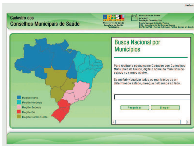
Figura 1 – Fac Símile da Página de Busca Dinâmica do CD-ROM ‘Cadastro dos CMS’

Digitalizado e tornado dinâmico por meio de um CD-ROM, o Cadastro dos CMS foi apresentado na ‘142ª Reunião Ordinária do Conselho Nacional de Saúde’, realizada nos dias 5 e 6 de Maio de 2003, ocasião em que foi saudado pelos Conselheiros. A figura 1 ilustra a página de busca dinâmica por CMS, mostrando suas diferentes possibilidades.