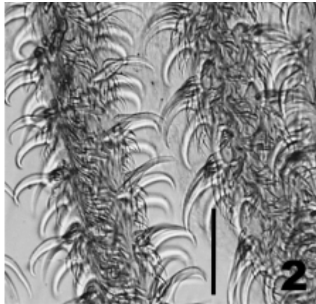
Figura 2: Escólice de P. crassicolle oncotaxia da região meta basal externa. Barra das figuras = 100 \mu m.