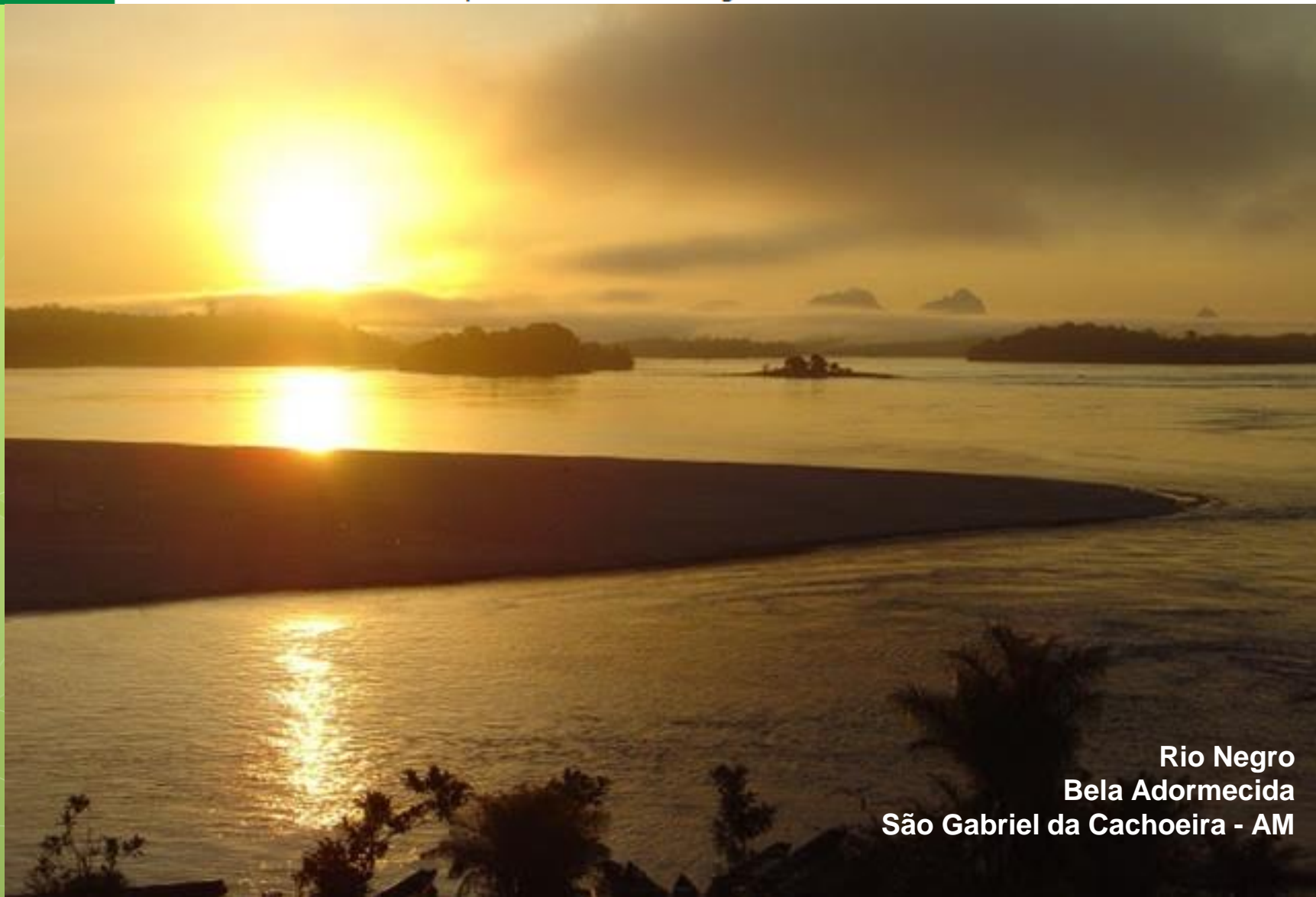
Rio Negro Bela Adormecida São Gabriel da Cachoeira - AM

"Estudo e Pesquisa dos CAPS das Regiões Centro Oeste e Norte"