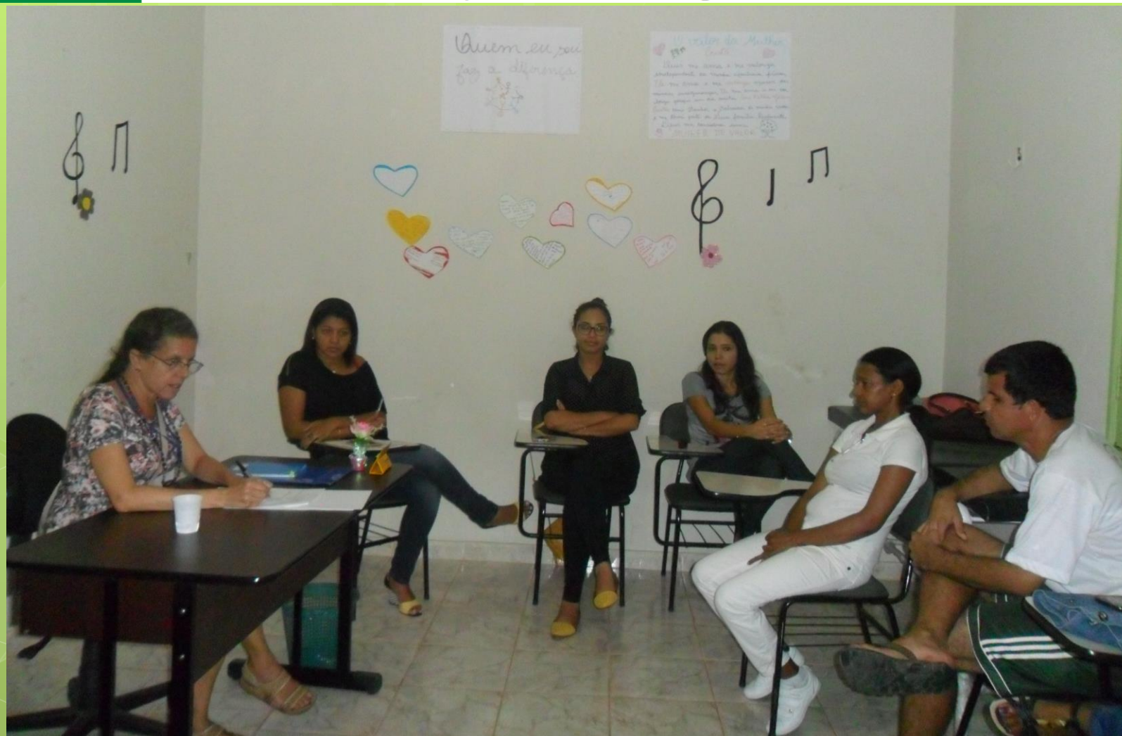
Roda de conversa Itaituba - PA

"Estudo e Pesquisa dos CAPS das Regiões Centro Oeste e Norte"