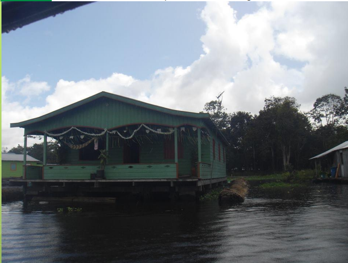
Bairro flutuante Cacau Pirêra Irlanduba - AM

"Estudo e Pesquisa dos CAPS das Regiões Centro Oeste e Norte"