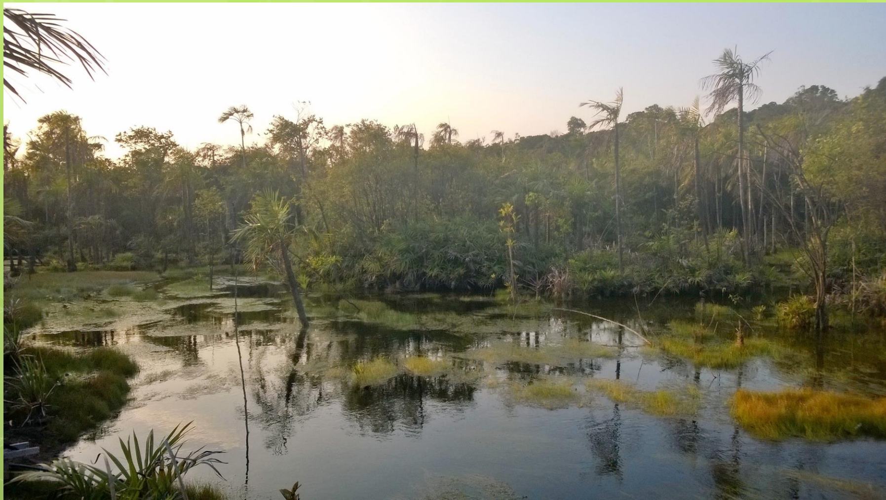
Lago do Macaco - Rio Tapajós Alter do Chão Santarém - PA

"Estudo e Pesquisa dos CAPS das Regiões Centro Oeste e Norte"