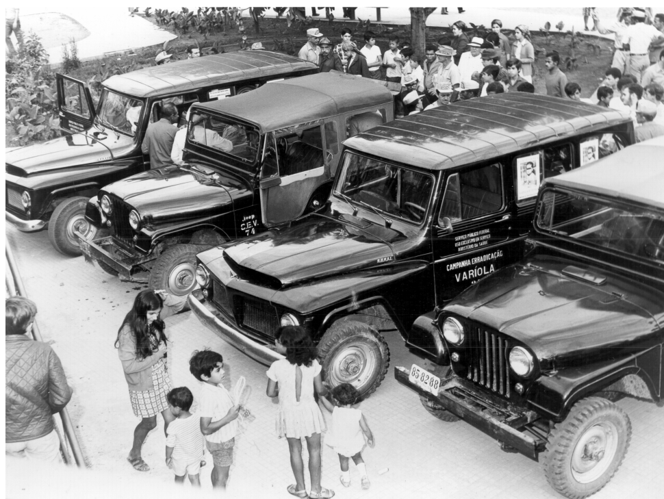
Atividades de campo da Campanha de Erradicação da Varíola (s/d). Acervo Claudio do Amaral/ DAD/ COC/ Fiocruz

Caberia ao Comitê Executivo realizar o acompanhamento das atividades de vacinação em nível local, pelo prazo necessário à obtenção de uma razoável porcentagem de vacinações, organizando e participando das várias equipes necessárias ao desenvolvimento do trabalho, além do fornecimento do material para vacinação, o registro, instrução e treinamento dos executores locais. Também era sua incumbência obter os recursos materiais e humanos, necessários ao desenvolvimento de “campanhas rápidas e eficientes, quantitativa e qualitativamente”, ressaltando a importância destas atividades serem concluídas no prazo de meses, ao invés de anos, como vinha ocorrendo. Para tanto era recomendada a utilização preferencial de pistola injetora a jato ( jet injector gun ), defendida como de maior rendimento e mais econômica, do que o processo da multipuntura. Além disso, caberia também promover a seleção e treinamento de pessoal de nível local, para a realização efetiva da fase de vigilância, “medindo e assegurando os resultados obtidos pela vacinação em massa”, seguindo as normas internacionais de epidemiologia. Para tanto requeria-se a investigação dos casos de varíola ou alastrim e o estabelecimento das medidas destinadas a enuclear os focos localizados (Ministério da Saúde, 1973: 13-16).