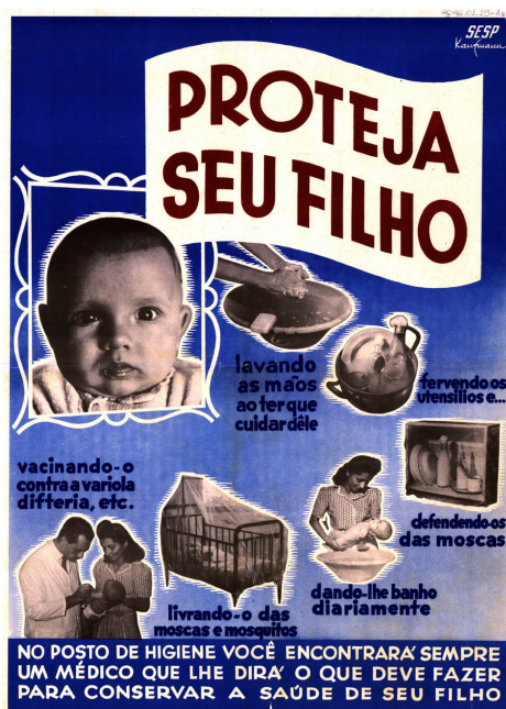
Cartaz de educação sanitária do SESP (s/d)

A educação sanitária tinha por finalidade “formar na coletividade brasileira uma consciência familiarizada com os problemas de saúde”, entendida, inicialmente, como a divulgação de informações sobre saúde, visando à recomendação de regras de higiene, para a prevenção de doenças transmissíveis 74 . Posteriormente, os conceitos de educação sanitária foram se aproximando, cada vez mais, das mudanças implementadas na área de educação em geral (Bastos, 1953). Cabe ressaltar que até este momento, a educação sanitária estava ajustada com a perspectiva de produzir mudanças de comportamento, que foi, posteriormente questionada, por uma nova concepção do processo educacional, incorporada na área de saúde, a partir da década de 1970.