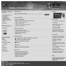
Biblioteca Virtual em Saúde Bioética e Diplomacia em Saúde http://bvsbioeticae diplomacia.fiocruz.br