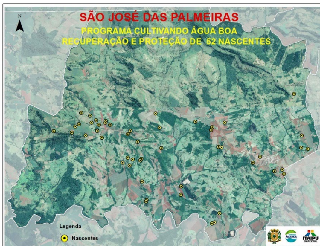
FIGURA 2: Nascentes recuperadas até 2017.