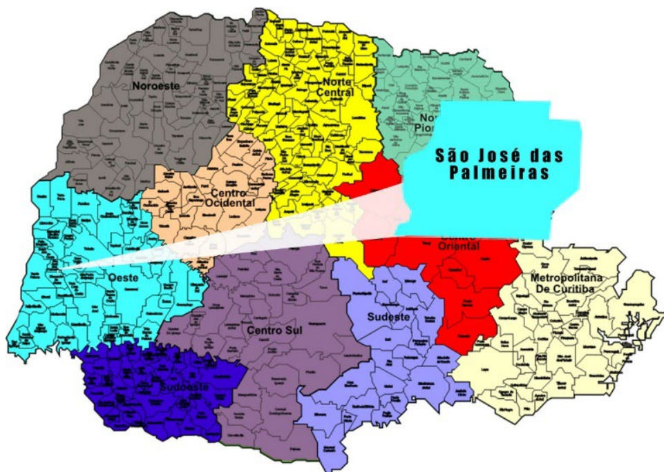
FIGURA 1: Localização do Município de São José das Palmeiras.