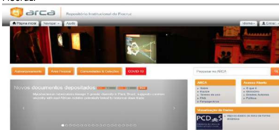
Figura 5 – Página principal do Arca – Repositório Institucional da Fiocruz.

uma equipe de Bibliotecários e Analistas de Sistemas, que atuam diretamente como administradores da base, gerenciando todas as comunidades do Repositório e fornecendo subsídios para apoio tecnológico e informacional, treinamentos, atendimentos e suporte. Os NAACs possuem uma composição mínima de profissionais, de acordo com a especificidade da estrutura organizacional (Vice-Diretor de Pesquisa, Ensino, Desenvolvimento Institucional, Desenvolvimento Tecnológico, Informação e Comunicação). Vale destacar que nos NAACs, os profissionais da área de informação (preferencialmente bibliotecários) atuam na gestão, certificação e aprovação dos documentos de forma a garantir a qualidade e a autenticidade dos dados e do material depositado. Eles são responsáveis pelo fluxo da gestão informacional de toda a produção das Unidades Técnico Científicas da Fiocruz.