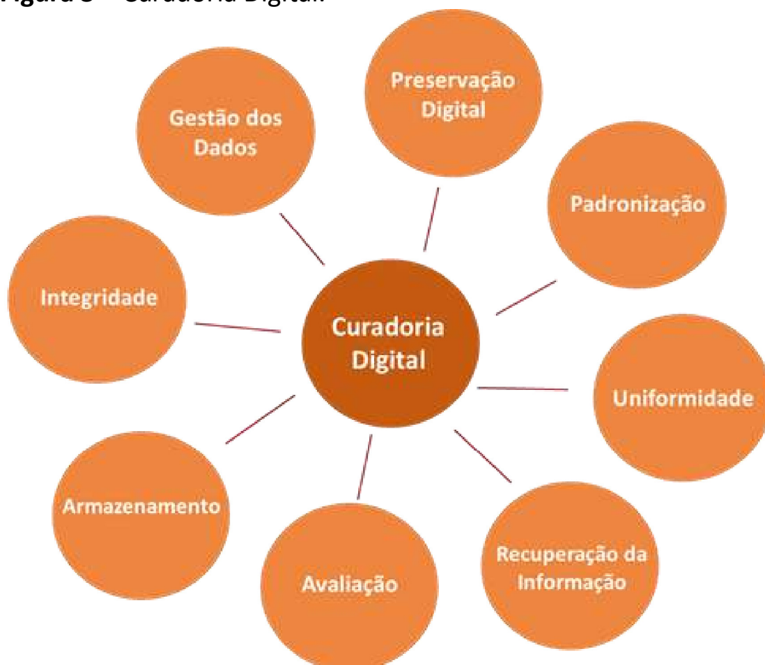
Figura 3 – Curadoria Digital.