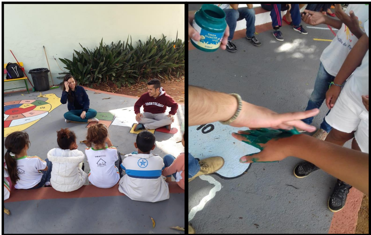
Figura 2. Atividades de Educação em Saúde Bucal. Na figura do lado esquerdo, dinâmica de higienização das mãos onde as crianças percebem, por meio das mãos pintadas com guache, como ocorrem as contaminações cruzadas e transmissões de doenças. Na figura do lado direito, após o jogo de perguntas e respostas, os acadêmicos dão um feedback com aprofundamento dos temas abordados.