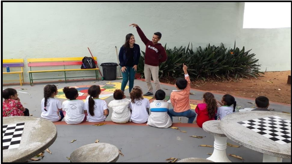
Figura 1. Atividades de Educação em Saúde Bucal. Jogo Imagem e Ação com temas relacionados à Saúde Bucal.