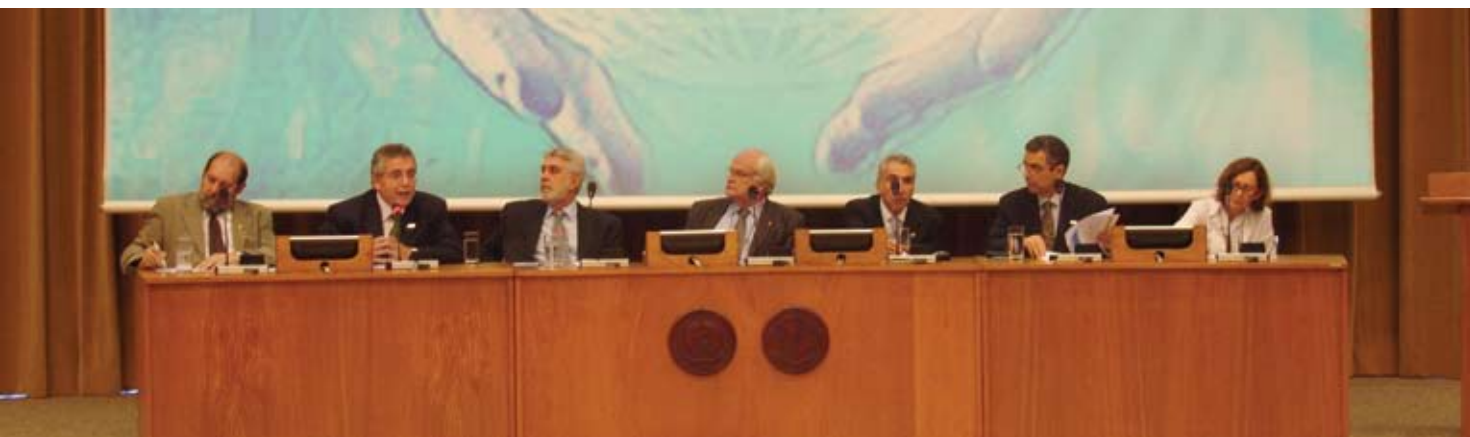
Aula Magna do Curso de Saúde Global e Diplomacia da Saúde no auditório da Opas.