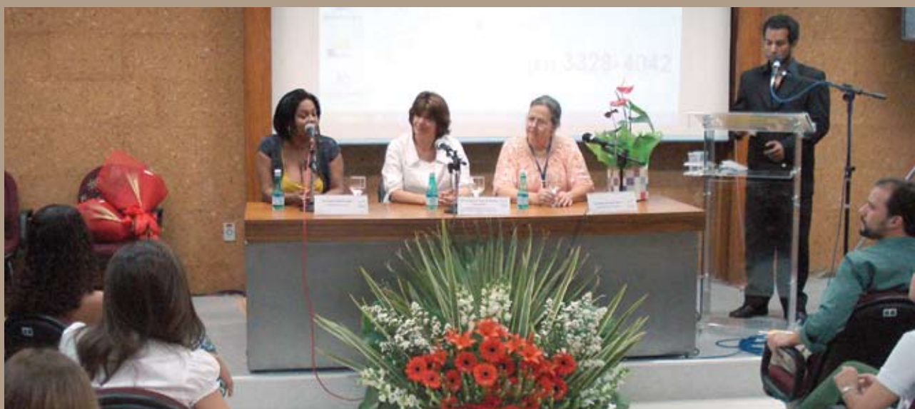
Solenidade de encerramento da 1ª turma do curso de Gestão de Políticas de Alimentação e Nutrição.

O Desenvolvimento como Escola de Governo e a Gestão do NFE foram os destaques nas atividades de ensino da FIOCRUZ BRASÍLIA. Fortalecendo-se como Escola de Governo, a unidade revisou seus regimentos, normas e critérios de avaliação de cursos, procurando aproximá-los das seguintes características: