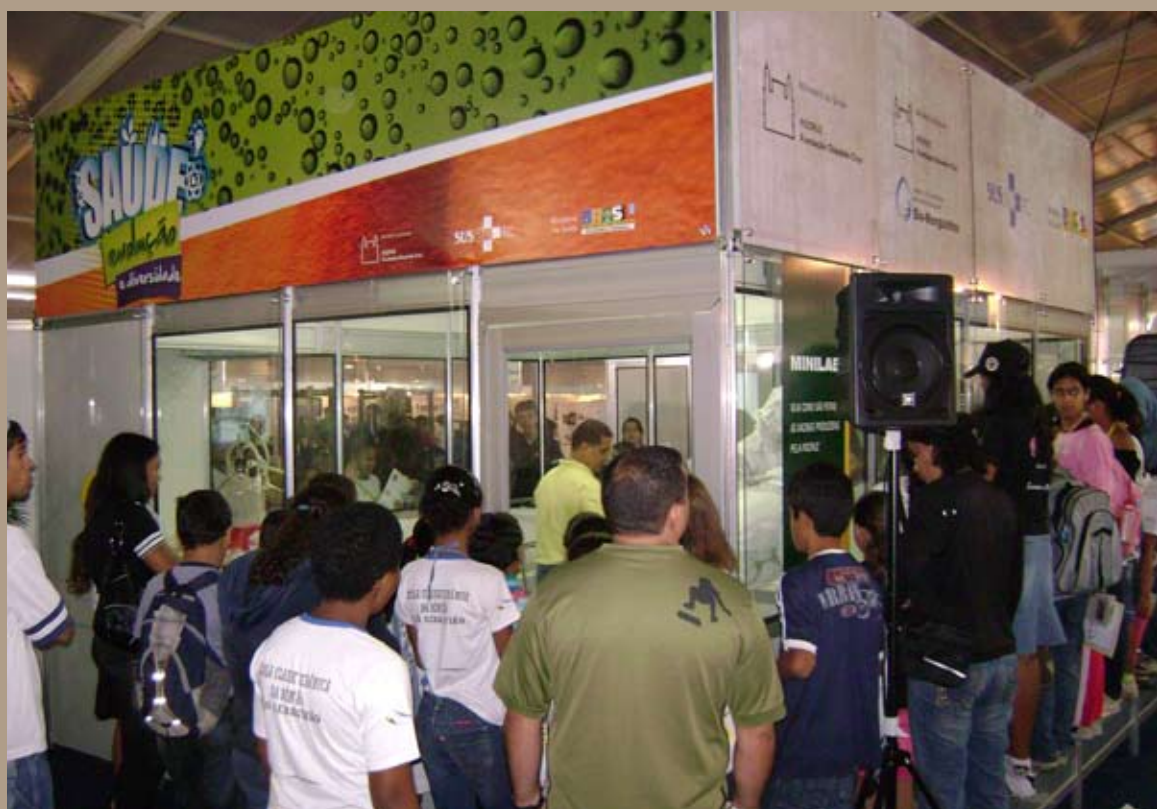
Estande da FIOCRUZ BRASÍLIA e do Ministério da Saúde na V Semana Nacional de Ciência e Tecnologia