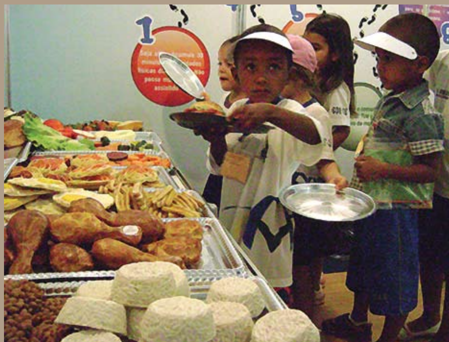
Aprenda a Comer Brincando - estande da FIOCRUZ BRASÍLIA no VI Ciência para a Vida da Embrapa