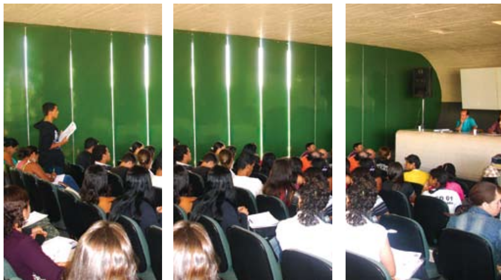
Fórum Ciência e Sociedade - visita dos alunos ao Conselho Regional de Saúde de Taguatinga.

Em 2008, a FIOCRUZ BRASÍLIA investiu no desenvolvimento de projetos e atividades no campo da informação em saúde, apoio a políticas públicas, desenvolvimento tecnológico e educação em saúde. Grande parte desses projetos é realizada em cooperação com outras instituições como a Universidade de Brasília, a Universidade de São Paulo, Ministério da Educação e outras unidades da Fiocruz, parceiros que ampliam e fortalecem a atuação da FIOCRUZ BRASÍLIA na Capital Federal.