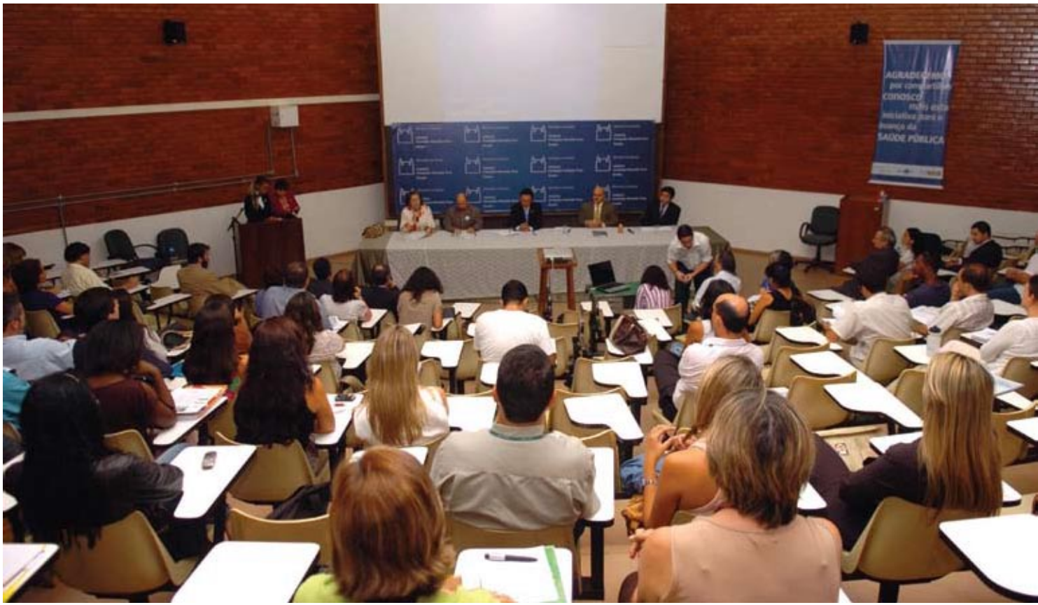
Aula Inaugural NFE