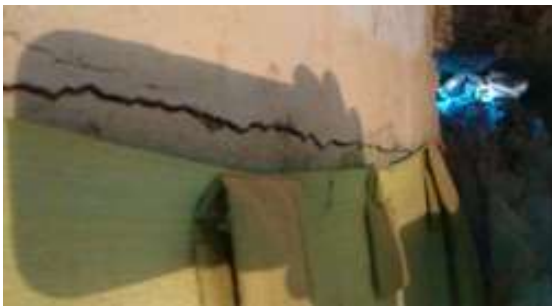
Figura I.1.8 - Rachadura longitudinal de uma habitação.

Na Rua São José não é diferente. Assim, diante de processos construtivos autóctones, é comum que em muitas dessas construções sejam encontrados alguns problemas, como as rachaduras. Depois das obras do PAC, tais problemas construtivos aumentaram, consideravelmente, segundo relato dos moradores da São José. Podemos ver a dimensão desse problema na imagem que segue (Figura I.1.8).