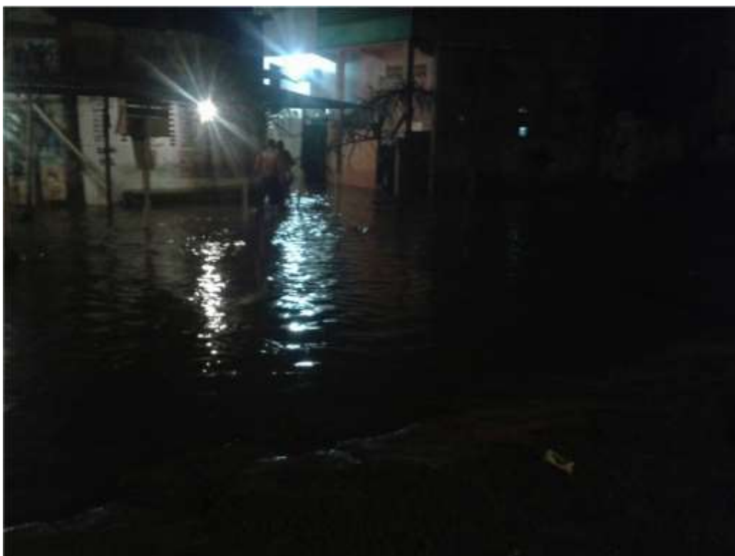
Figura I.1.7 - Acesso à Rua São José pela Leopoldo Bulhões. Enchente com água no nível da nova via. Março 2016.