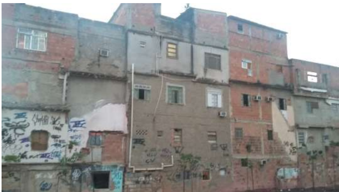
Figura I.1.3 - Habitações na Rua São José com fundos para a extensão da rua Uranos, ao longo da via férrea. Março, 2016.

apenas, as unidades residenciais de um dos lados da Rua São José, especificamente as casas posicionadas entre a Rua São José e a nova avenida paralela à Leopoldo Bulhões, construída pelo PAC, que dará seguimento à rua Uranos. Esta via, além da rota normal em direção ao centro da cidade, oferecerá acesso para a avenida Dom Hélder Câmara, cortando parte da comunidade no setor onde foram instalados novos equipamentos públicos a partir das intervenções do PAC. A Figura I.1.3 mostra os fundos das casas que permaneceram, após as remoções das habitações do lado da rua São José, unidades estas que seriam contempladas na nova proposta de remanejamento feito pela EMOP.