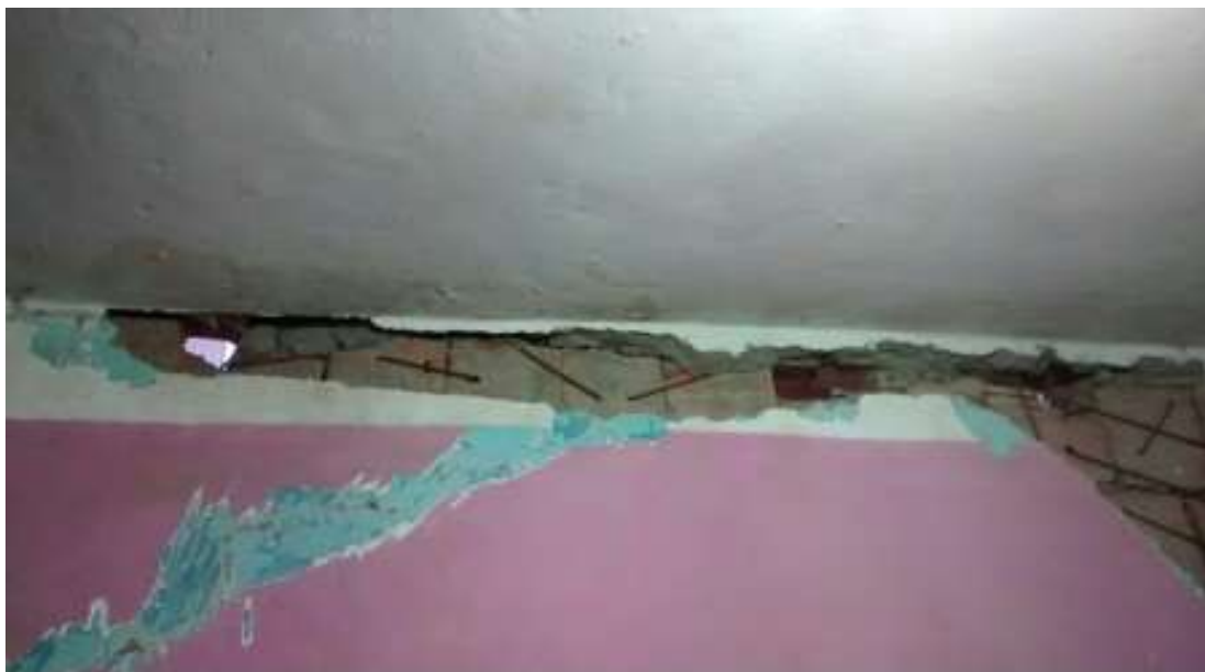
Figura I.1.9 - Aplicação de grampos metálicos para amenizar os problemas de rachaduras em decorrência das obras do PAC, feitas pela EMOP, em 2015.