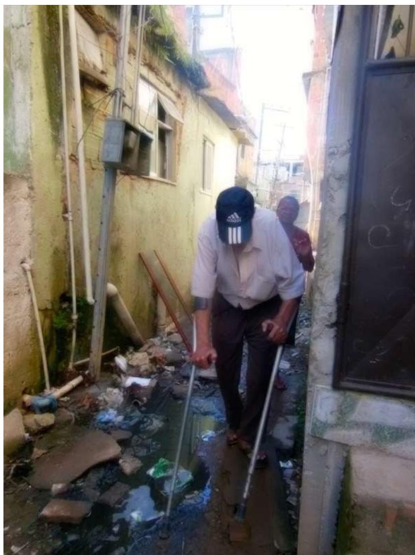
Figura I.1.1 - Condições da Rua São José em fevereiro de 2014.

Com efeito, a Rua José configura uma sobreposição de processos de vulnerabilização ambientais e sociais, que concorrem para a extrema precariedade das condições de vida de seus moradores, e de sua situação de saúde, sintetizada na imagem abaixo (Figura I.1.1).