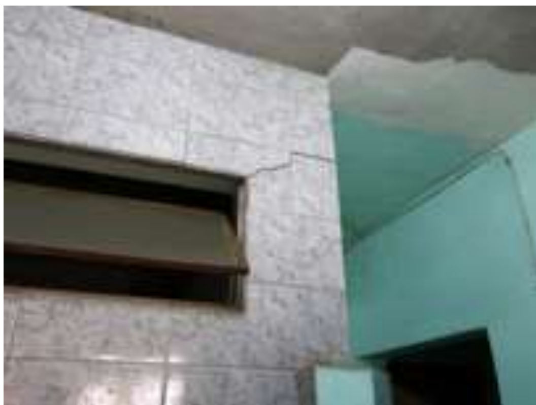
Figura I.2.7 – Rachadura na parede da cozinha da casa de D. Geralda. Março, 2016.