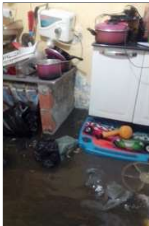
Figura I.1.4 e I.1.5 - Interior de moradia com alto nível d'água.