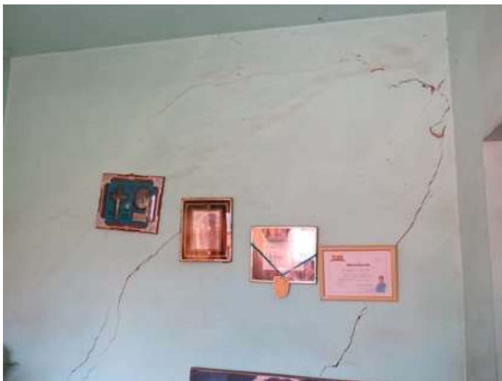
Figura I.2.4 – Rachaduras na parede da sala de D. Geralda. Março, 2016.