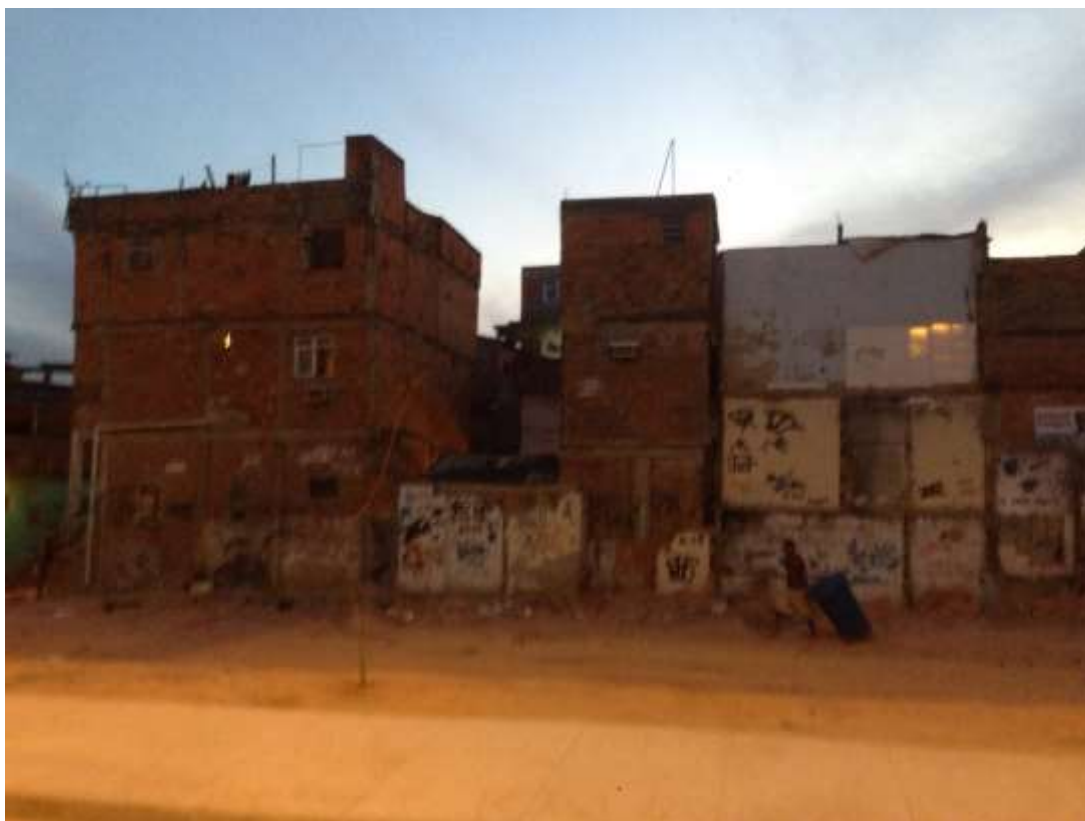
Figura I.1.12 – Rua São José, na área paralela à via férrea denominada como 'Iraque'. Março, 2015. Acervo: Projeto Arquitetando Subjetividades - Unisuam.

Os “reparos” oferecidos pela EMOP para fechamento das rachaduras não foi aceito por muitos moradores por acreditarem que se tratava de uma tentativa de “maquiar” os problemas estruturais gerados pelas obras do PAC. Problemas que os moradores creditam às demolições parciais de todas as construções que estavam voltadas para ampliação da Rua Uranos (duplicação da Leopoldo Bulhões). Dentre outros, destacamos os impactos da trepidação de máquinas e caminhões no local, e a linha do trem. A demolição das casas que ficavam voltadas para a nova via também gerara grande vulnerabilidade para essas habitações. Tais casas eram geminadas com as casas de um dos lados da Rua São José. O local das demolições, nomeado de Iraque, ficou sem nenhum tipo de tratamento, gerando, pelo seu estado de destruição e ruínas, segundo relatos dos moradores, um aspecto de guerra. A figura I.1.12 abaixo mostra a paisagem “Iraque”, que predomina na área da rua São José, em estado de demolição incompleta em meio aos escombros; a paisagem da fotografia feita em março de 2015, permanece atual.