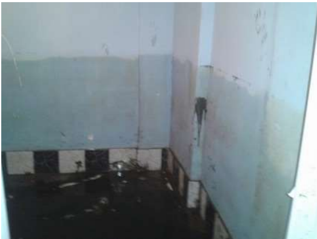
Figura I.1.6 - Moradia pós- enchente: marca de umidade mostra o nível alcançado pela água. Março, 2016.