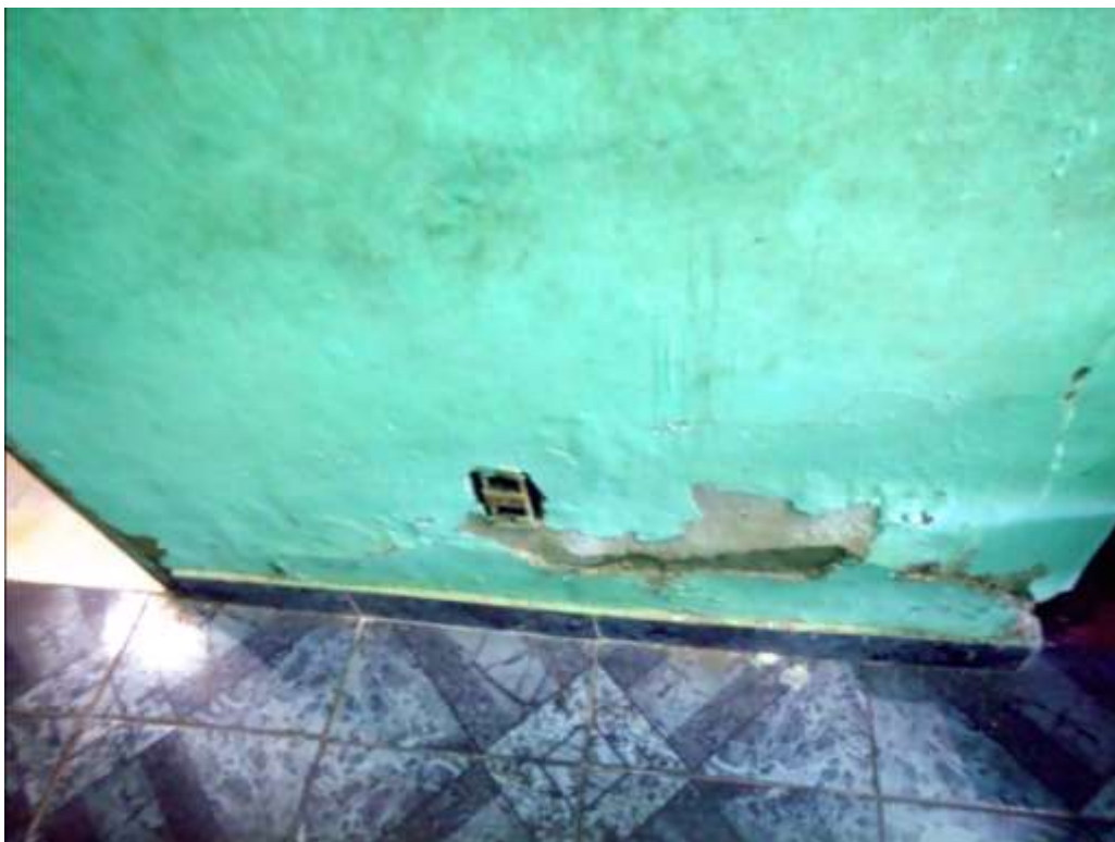
Figura I.2.3 - Rachaduras na casa da moradora. Março, 2016.