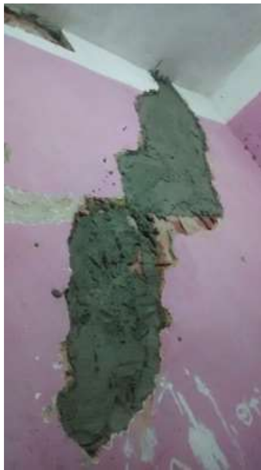
Figuras I.1.10 e I.1.11 - Funcionários da EMOP concluindo “reparos” nas rachaduras. Acervo: Projeto Arquetetando Intersubjetividades. 2015. Foto: Cedida por morador.