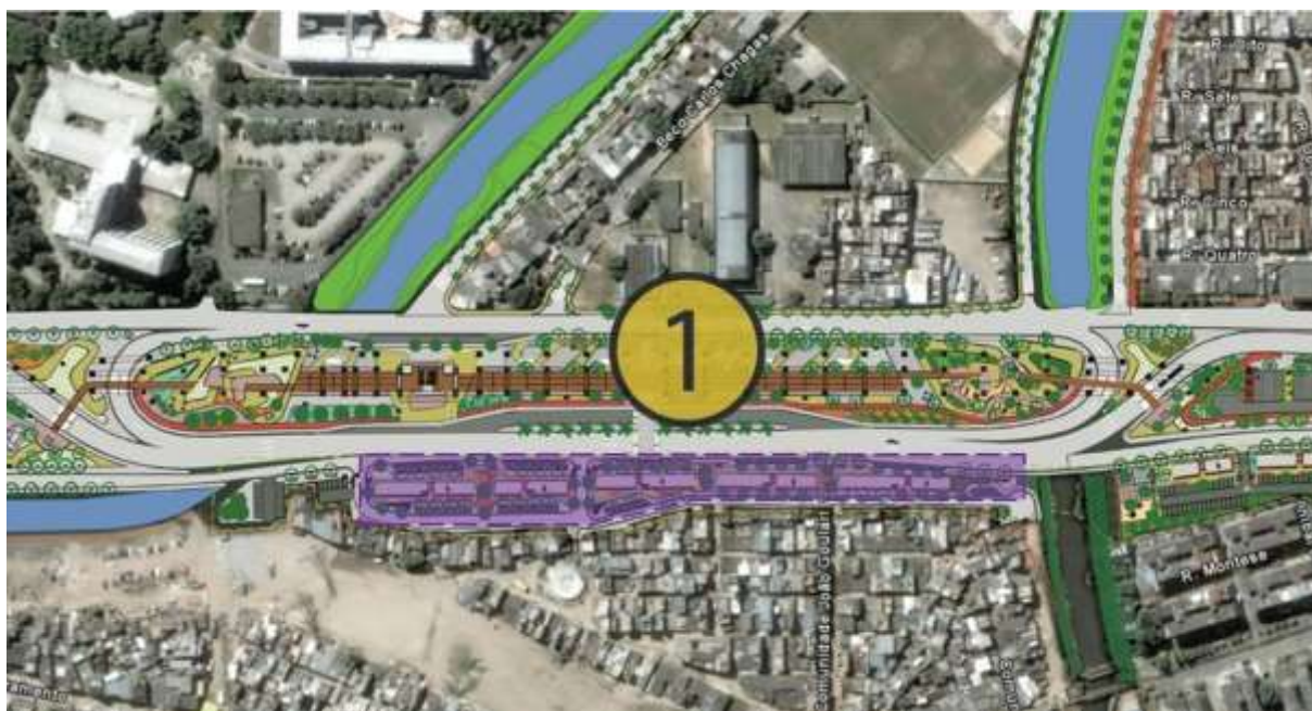
Figura I.1.2 - Projeto de arquitetura desenvolvido pelo arquiteto Jorge Mario Jauregui. Trecho ampliado da área de realocação prometida para os moradores da Rua São José e adjacências. Em lilás, área correspondente a implantação dos conjuntos habitacionais. Disponível em: Http://bit.ly/1SrgcCf . Consultado em 24/03/2016.

O PAC Manguinhos tinha como proposta inicial para a Rua São José a remoção das habitações existentes paralelamente à linha férrea, para a posterior construção e recuperação de espaços públicos além de implantação de conjuntos habitacionais de interesse social, para realocação dos moradores locais. Na figura I.12, podemos observar o trecho previsto para remoção das habitações marcado em cor lilás, ao longo das “ramblas” marcada com o número 1, e posterior construção de conjunto habitacional (marcação feita por nós).