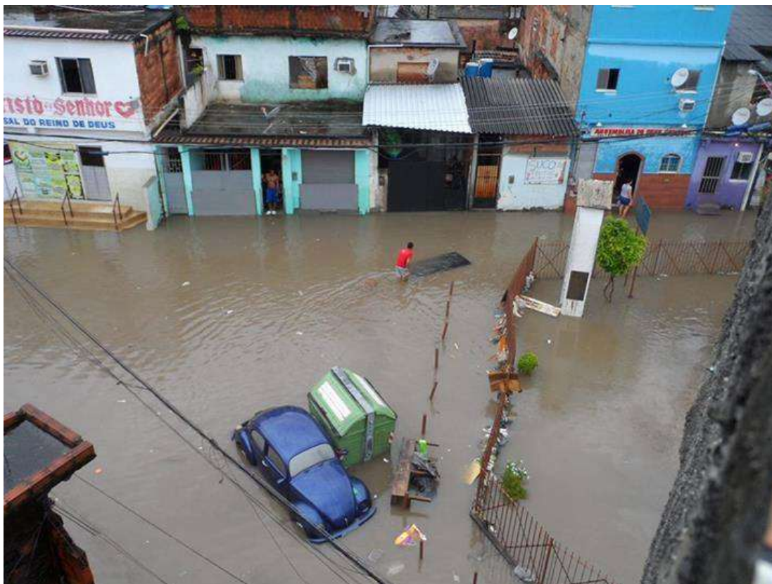
Figura I.3.1 - Comunidade de CHP2. Enchente de Dezembro 2013.