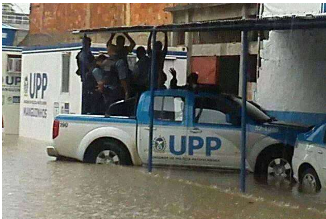
Figura I.3.2 - Instalação da UPP: Rua Santana do Livramento – Vila Turismo. Enchente de Dezembro 2013.