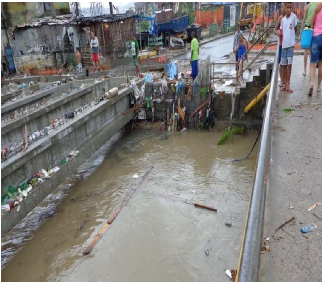
Figura I.3.3 - Pontilhão sobre o Rio Faria Timbó reconstruído pelo PAC em 2010. Enchente de Dezembro 2013.

A denúncia dos moradores acerca de ser a ponte sobre o rio Faria Timbó uma das causas da piora das enchentes foi corroborada pela Prefeitura, no documento da Rio Águas anexado ao relatório do CREA em resposta à demanda do Ministério Público do Estado do Rio 9 , a partir da demanda dos moradores de Manguinhos. Escreve a Rio Águas, em 21/01/2014, na solicitação que faz à empresa que o pontilhão: “...Apresentar projeto aprovado da ponte executada sobre o Rio Faria-Timbó para análise na Fundação Rio-Águas. Esta medida se faz necessária, pois a referida ponte está dificultando a passagem das águas do curso d’água...”.