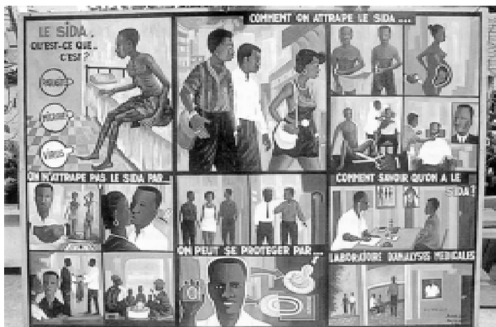
Cartaz com informações para a prevenção da Aids, Dakar, Senegal.

Estas aproximações a um estudo comparado das peças segundo as características nelas impressas pelo campo da produção, são, entretanto, insuficientes. Qualquer avaliação no campo da comunicação só pode se “fechar” a partir de estudos de “recepção”, que possam recuperar qualitativamente, que tipo de relação se estabelece entre emissão (E) e recepção (R), os sentidos produzidos por E, e os sentidos atribuídos por R, apreensíveis apenas por sua própria produção discursiva.