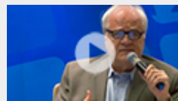
Paulo Buss Saúde na Agenda 2030