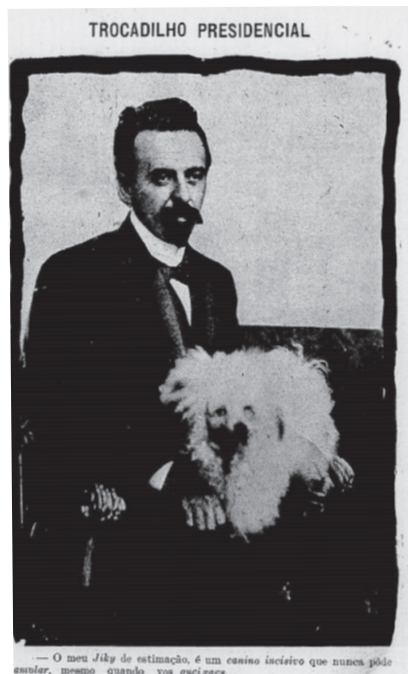
Figura 2 – Nilo Peçanha com Jicky