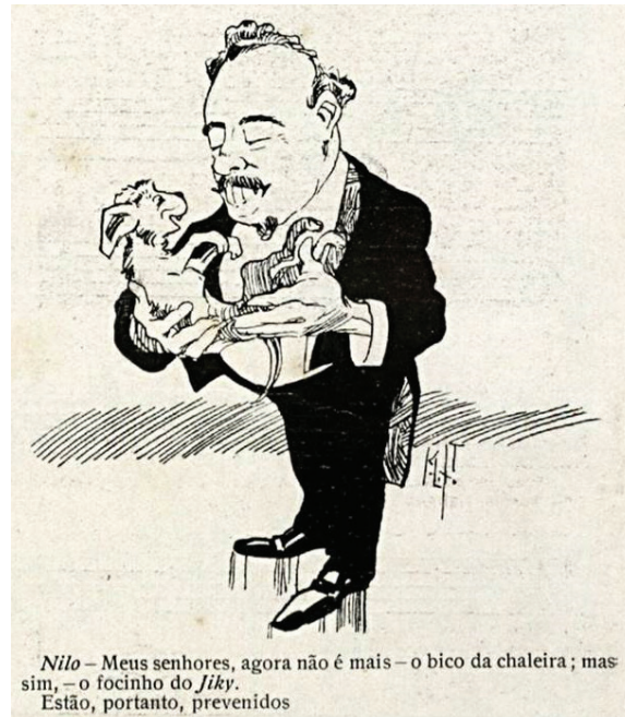
Figura 3 – Charge representando Nilo Peçanha e Jicky

Fonte: K. Lixto. Fon-Fon , Rio de Janeiro, n. 30, 24 jul. 1909, s.p.; Hemeroteca Digital/Biblioteca Nacional.