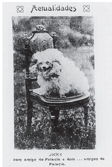
Figura 1 – Reprodução de fotografia de Jicky