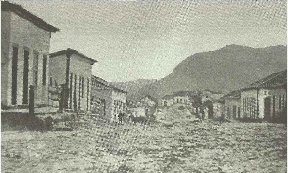
Figura 2 - Santa Maria/RS (1890)