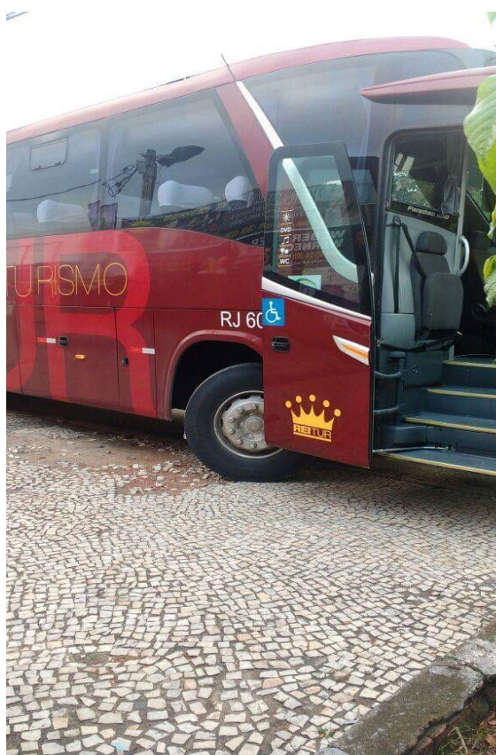
Figura 4 – Locomoção no território