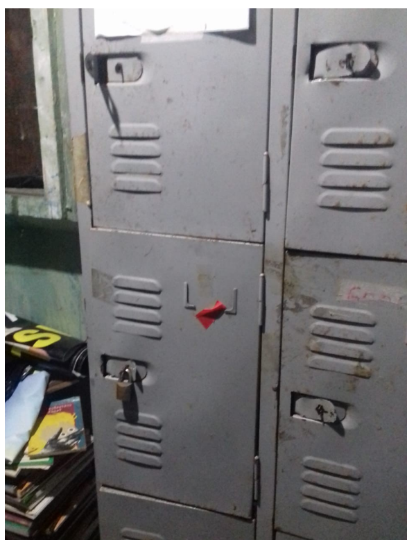
Figura 1 – Falta de estrutura absurda