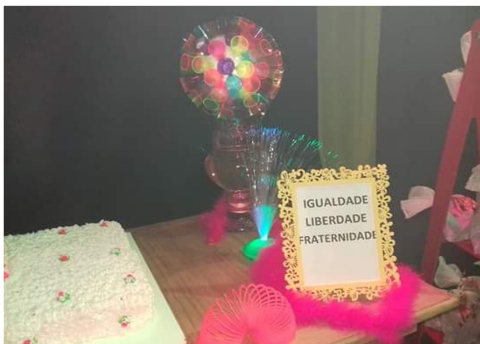
Figura 3 – Utopia