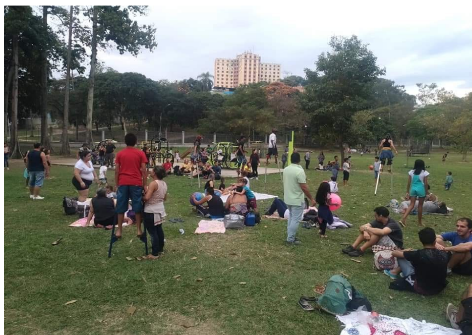
Figura 6 – Ocupação dos espaços públicos promovendo a inclusão