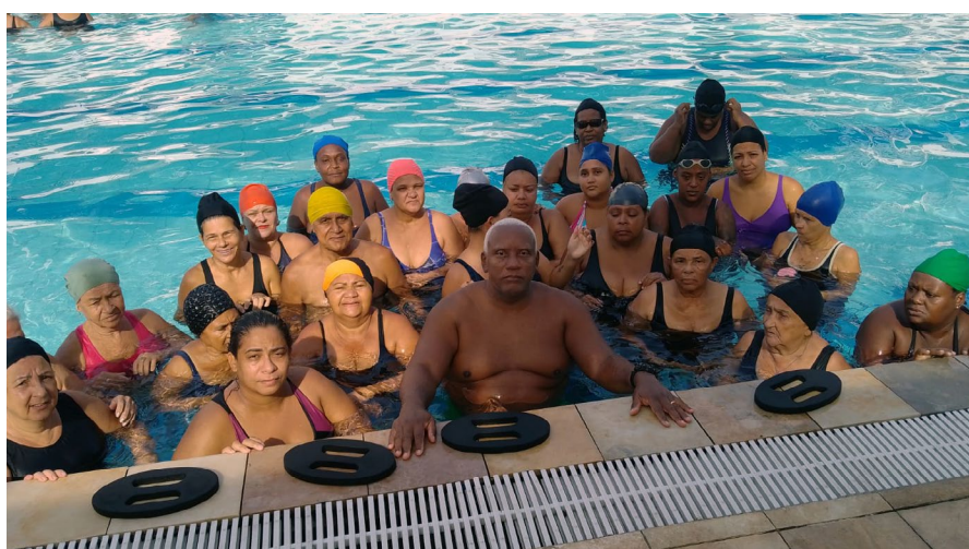
Os alunos de natação e hidroginástica em Manguinhos hoje se mantêm alertas e vigilantes em defesa de um território saudável.

Na segunda semana de abril deste ano, o grupo de WhatsApp do O Manguinho recebeu muitas mensagens de moradores que se diziam preocupados. A preocupação era legítima e sincera. Segundo eles nos informaram, o Programa Cidade Integrada do Governo do Estado do Rio de Janeiro, em Manguinhos, começava apresentar alguns sinais de esgotamento, ou seja, o que antes funcionava muito bem, começou a apresentar problemas cotidianos. Essas mensagens partiram de alunos das aulas de natação e hidroginástica que acontecem no Complexo Esportivo de Manguinhos e Jacarezinho, que fica nas dependências do Colégio Estadual Compositor Luiz Carlos da Vila.