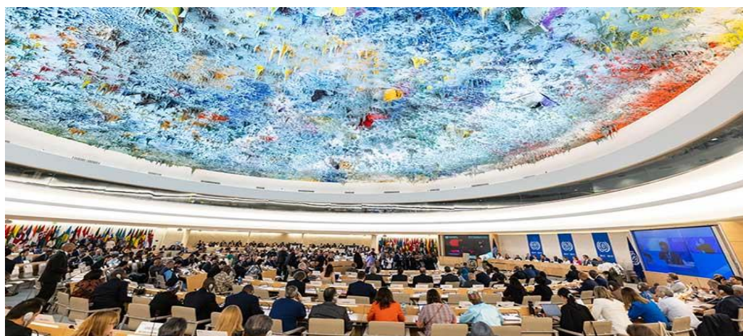
111 a . Conferência Internacional do Trabalho – Genebra, junho de 2023

Para este número dos Cadernos CRIS, foi analisado o robusto documento de 1.058 páginas 17 , de onde fizemos uma compilação minuciosa das denúncias relativas aos países da América Latina, como um ponto de partida para futuras análises mais aprofundadas e críticas que pretendemos fazer nas próximas edições dos Cadernos.