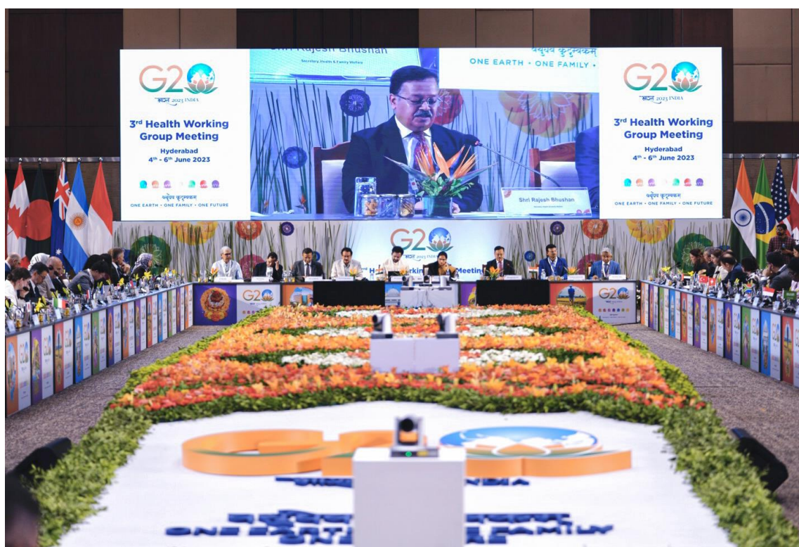
Imagem 1: Terceiro encontro do Grupo de Trabalho de Saúde do G20

De forma geral, dentre os produtos gerados a partir desta reunião, houve um avanço nas pautas sobre a criação de uma rede de P&D dentro da Plataforma Global de Contramedidas Médicas ( medical countermeasures ), o lançamento de um Centro de Mudanças Climáticas e Saúde para entender o impacto e a influência entre essas duas áreas, e a formação de um repositório online para convergir todas as iniciativas existentes de digitalização da saúde entre os países do bloco. Sobre este último ponto, a Índia também propôs um fundo de 200 milhões de dólares para ajudar na implementação da digitalização. No entanto, apesar de haver consenso entre os membros sobre a essencialidade de tecnologias digitais para alcançar uma cobertura universal de saúde, os delegados não chegaram a um acordo sobre as formas de financiar a sua implementação 64 . Cabe destacar que o fomento da tecnologia, nesse sentido, é entendido como um facilitador para garantir uma maior acessibilidade, facilidade e disponibilidade dos produtos e serviços de saúde, principalmente para a população mais vulnerável. É esperado que até agosto, na ocasião do quarto encontro do Grupo de Trabalho, a declaração conjunta dos ministros seja finalizada.