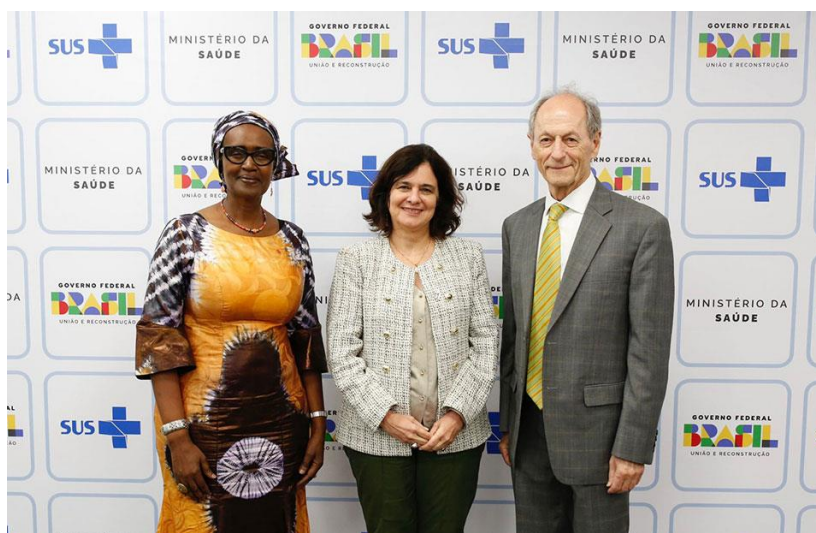
Diretora Executiva do UNAIDS, Winnie Byanyima; Nísia Trindade, ministra da saúde; e Michael Marmot, no anúncio do Conselho em Brasília, dia 6 de junho último

“Tenho o prazer de apresentar o anúncio do Conselho Global sobre Desigualdade, AIDS e Pandemias. É hora de converter as lições aprendidas em ação, reduzindo as desigualdades que impulsionam as crises de saúde de hoje e fortalecendo a preparação para uma pandemia no futuro”, disse Trindade. “O Brasil está determinado a fazer sua parte, defendendo maior colaboração e formulação de políticas baseadas em evidências para construir sistemas de saúde mais resilientes em todo o mundo.”