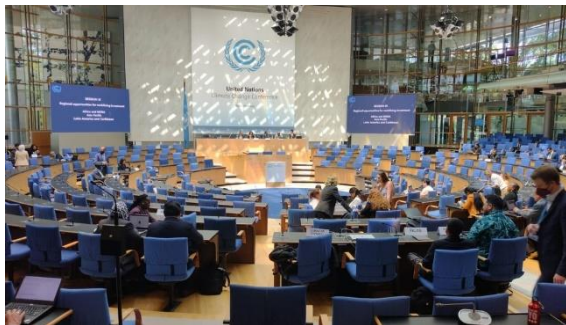
Conferência de Bonn de 2023 (SB58) — Foto:

As partes na Convenção-Quadro das Nações Unidas sobre Mudança do Clima (UNFCCC) retomaram as negociações na 58ª sessão do Órgão Subsidiário de Implementação (SBI) e do Órgão Subsidiário de Aconselhamento Científico e Tecnológico (SBSTA). A SBI e a SBSTA normalmente se reúnem duas vezes por ano, e esta sessão ocorreu em Bonn, Alemanha, de 5 a 15 de junho de 2023. Essas reuniões são significativas para o avanço das negociações climáticas antes da 28ª Conferência das Partes (COP), em Dubai.