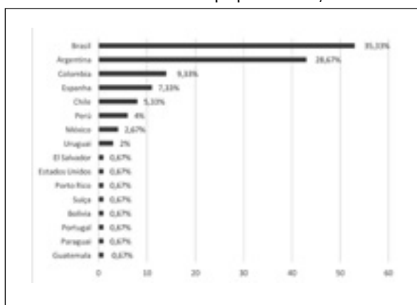
Figura 1 Percentual de membros da RIPeHP por país de vinculação institucional

Conforme indicado, o Brasil, com 35,33% e a Argentina, com 28,67%, são os países com maior número de pesquisadores na Rede. Os outros países com maior número de membros são: a Colômbia, com 9,33%; a Espanha, com 7,33%; o Chile, com 5,33%; o Peru, com 4%; o México, com 2,67% e o Uruguai, com 2%. Os outros oito países (Bolívia, El Salvador, EUA, Guatemala, Paraguai, Portugal, Porto Rico e Suíça) possuem apenas 0,67% cada.