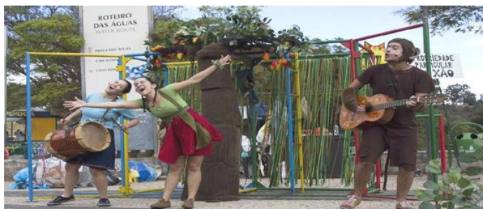
Figura 4: Manga, mangueira, meu pé de brincadeira.

Extrapolando: leve os estudantes para assistir uma peça de teatro para depois dialogar em sala. Sugerimos Manga, mangueira, meu pé de brincadeira (figura 4), do Grupo Galpão de Belo Horizonte, inspirado na fábula A árvore generosa de Shel Silverstein. A obra faz uma reflexão sobre a relação do homem com a natureza.