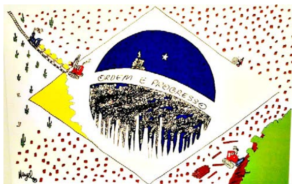
Figura 3: Charges e Tirinhas em Quadrinhos