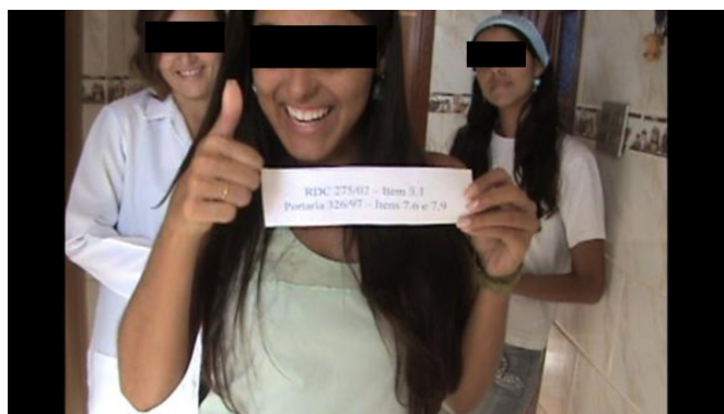
Figura 3. Fotograma de vídeo produzido e apresentado no primeiro semestre de 2009, mostrando a rotina de uma panificadora que não cumpria as BPF para alimentos.