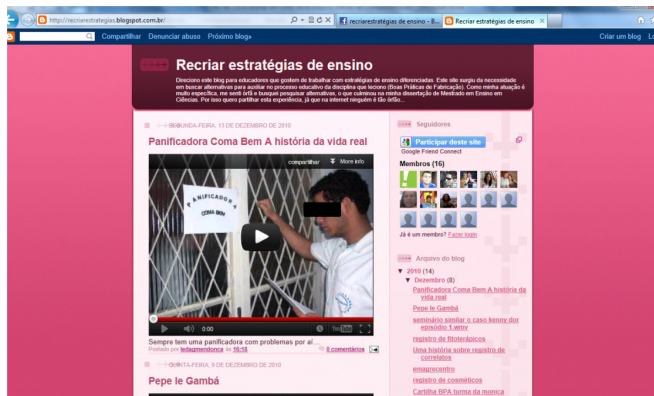
Figura 5. Visão do blog Recriar estratégias de ensino ( http://recriarstrategias.blogspot.com ).

O blog Recriar estratégias de ensino para divulgar roteiros de práticas pedagógicas e estratégias de ensino já havia sido desenvolvido pela professora ao longo do seu mestrado profissional em Ensino de Biociências e Saúde (IOC-FIOCRUZ). Foi sugerido, então, que os alunos compartilhassem seus vídeos postados no YouTube no blog. A Figura 5 mostra a aparência do blog.