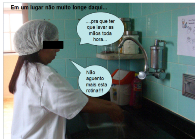
Figura 4. Fotograma de vídeo produzido e apresentado no segundo semestre de 2010, mostrando o funcionamento de uma indústria alimentícia que não cumpria as BPF.

não estão muito familiarizados, já que normalmente estão vendo a matéria pela primeira vez, pode se tornar um pouco cansativo e as atividades acabam facilitando o aprendizado e o tornando mais agradável.”