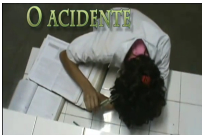
Figura 2. Fotograma de vídeo produzido no segundo semestre do ano de 2010 mostrando acidente de trabalho originário de falta de padronização e descumprimento das BPF na indústria de cosméticos.