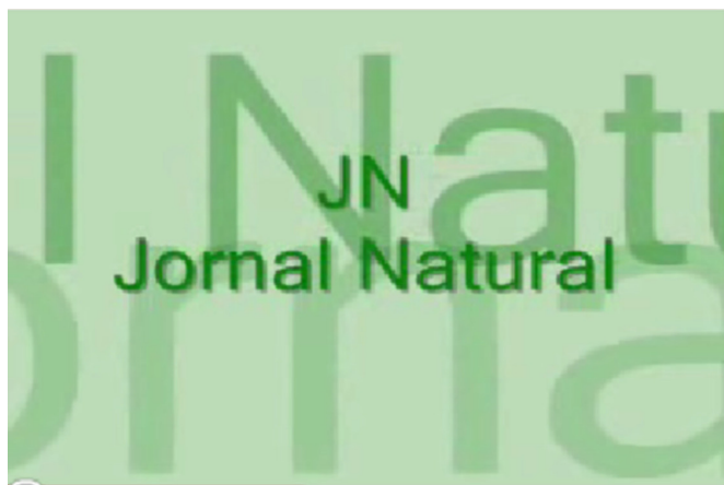
Figura 1. Fotograma de vídeo sobre BPF para farmácia de manipulação apresentado no primeiro semestre de 2008 na forma mista de encenação teatral e vídeo. Foi produzido o Jornal Natural para mostrar uma denúncia de uma indústria de cosméticos que havia cometido infrações sanitárias.

Aluno B: “A disciplina durante o semestre se mostrou muito atrativa durante a apresentação das atividades (estratégias de ensino). Pelo fato de ser uma disciplina baseada em leis e regulamentos com os quais os alunos