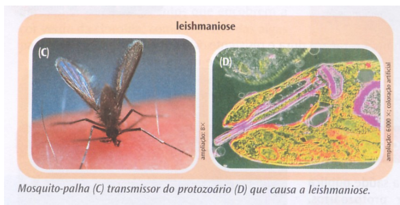
Figura 1- Ilustração de vetor e protozoário (partido) das Leishmanioses, sem fonte e nomes científicos - Braga et al. (2006).

Embora não seja uma prioridade dos livros de ciências do ensino fundamental descreverem em detalhes todos os sintomas e sinais das doenças, é fundamental que a LV seja citada e destacada como a forma mais grave das Leishmanioses, pois se não for tratada pode evoluir para óbito. Apesar disso apenas um livro a descreveu.