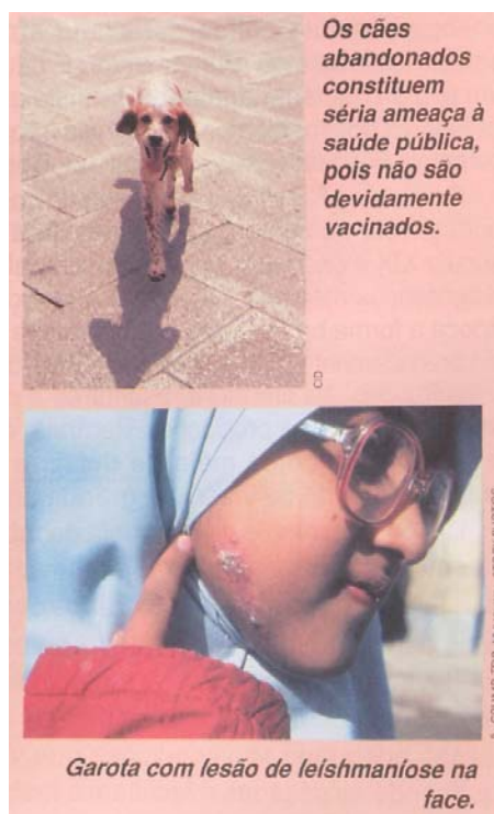
Figura 2 – Texto errado sobre vacinação e lesão não característica da LTA – Bortolozzo e Maluhy (2006).

(2006). Os outros dois descrevendo o combate ao “inseto transmissor”, “mosquito-palha”- Costa (2006,p.99); Braga et al. (2006). Costa (2006) e Gewandsnajder (2006) acrescentaram também o tratamento de doentes.