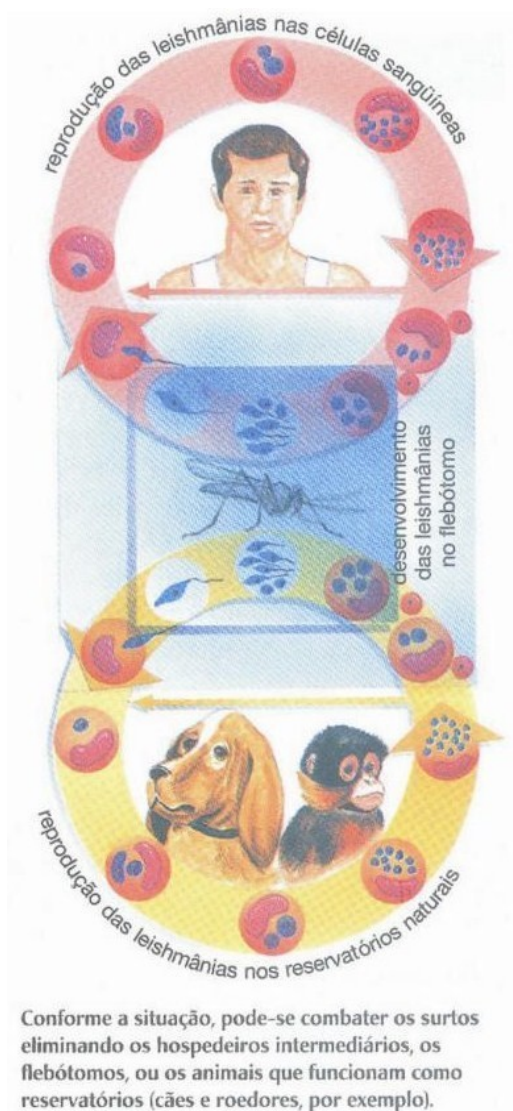
Figura 3- Ciclo de transmissão com vetor, reservatórios e prevenção inadequados - Frota-Pessoa (2005).

As medidas preventivas e de controle para as Leishmanioses citadas nos livros de biologia apresentam erros e linguagem técnica sanitária imprópria. São descritas como informações de educação em saúde normativas e descontextualizadas da realidade, não promovem a participação da comunidade no processo profilático. É importante que essas medidas alcançassem a comunidade em sua totalidade. Poderiam ser descritas medidas preventivas acessíveis à população.