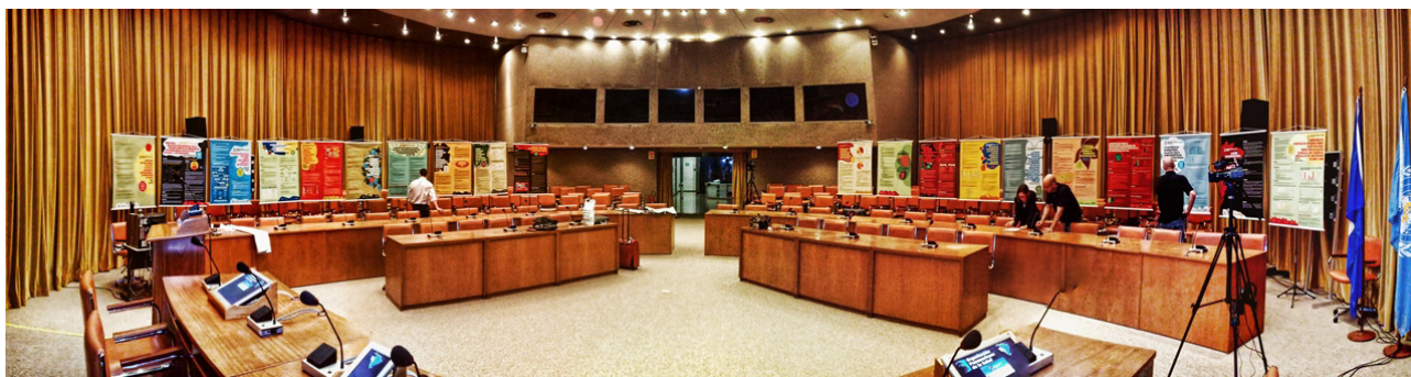
Exposição dos posters apresentando os Trabalhos de Fim de Curso dos alunos do I Curso de Especialização em Saúde Global e Diplomacia da Saúde. Auditório da Representação da OPS em Brasília. Abril, 2009. Designer dos posters e fotógrafo: Heron Ramos.

problema que fosse relevante ou tivesse que ser enfrentado no seu desempenho cotidiano e foi acompanhado nessa tarefa por um tutor, especificamente designado para isso. Os TFC foram apresentados na forma de posters na sessão final de encerramento do Curso (Figura).