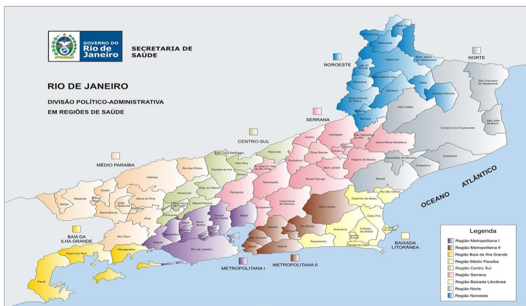
Figura 2 - Mapa das regiões de saúde do estado

Para contemplar os objetivos específicos, foram incluídos ainda os pacientes registrados como caso novo no SITE TB, desde que tivessem registro concomitante no GAL durante o período de estudo.