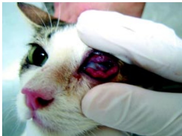
Figura 1. conjuntiva hiperêmica de aspecto granulomatoso, folículos de coloração amarelada e quemose.