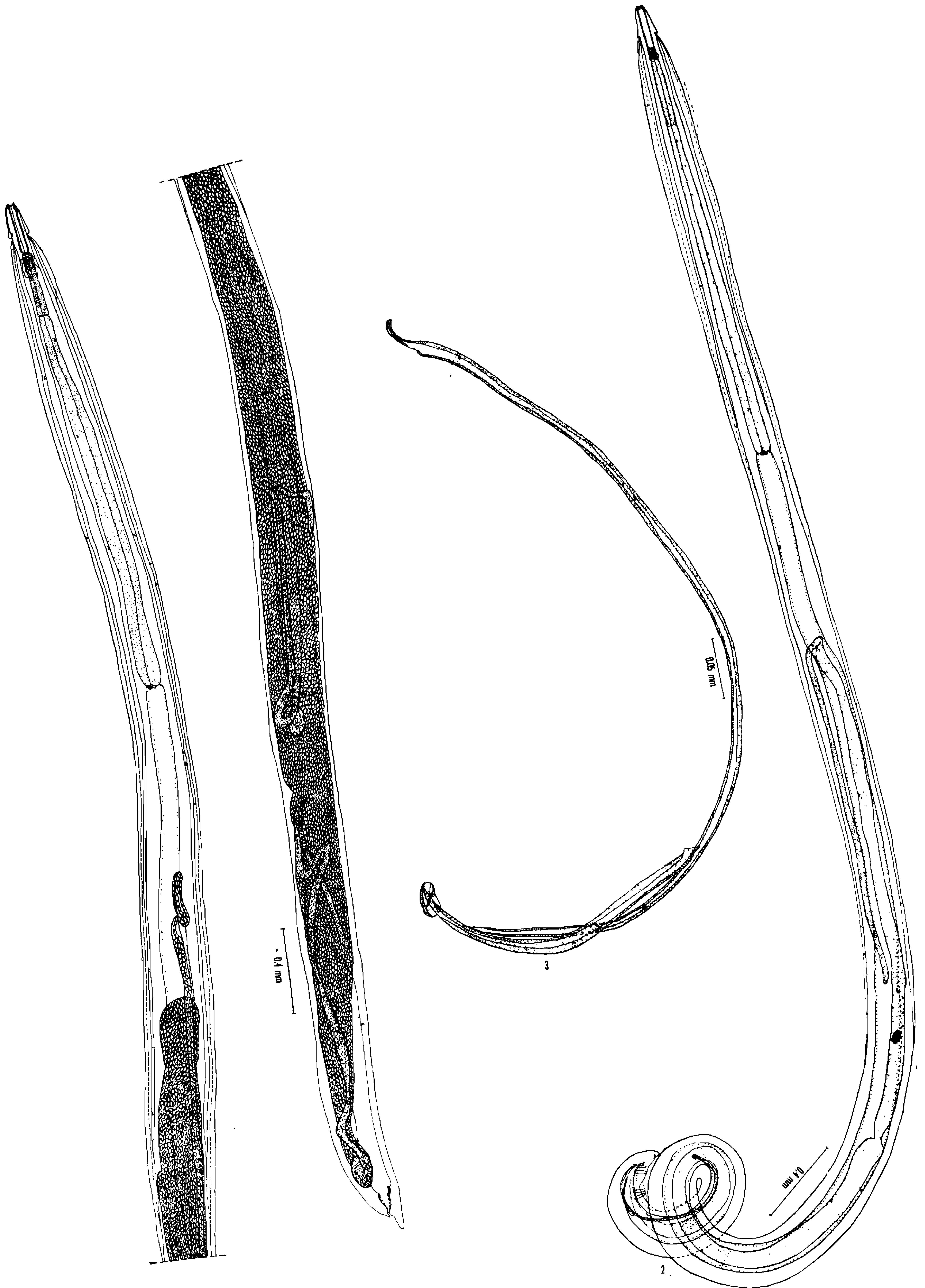
Vicente & Gomes: Nematódeo spirurídeo