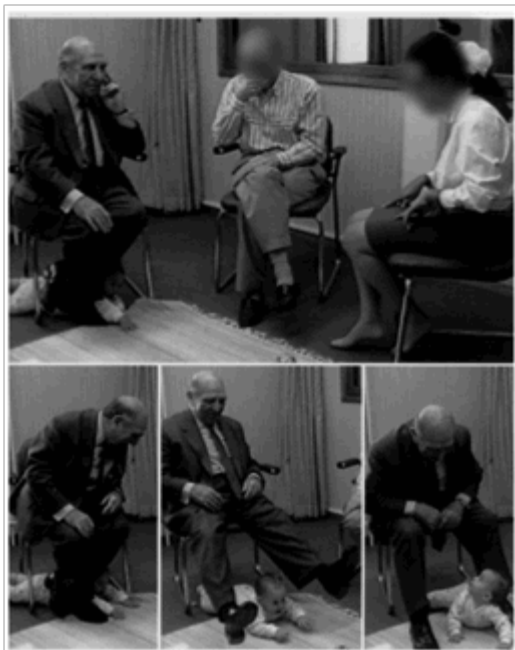
Figura 5: Lebovici em uma consulta terapêutica com pais e bebê