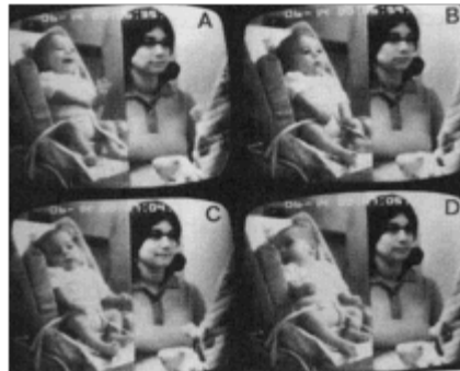
Figura 3: Still-Face Paradigm

Fonte: GUEDENEY, Antoine. The era of video in infant mental health. In: AKKO WAIMH REGIONAL CONFERENCE, [2009], [Acre, Israel]: [s.n.], [2009]. Disponível em: < http://infant-mh.co.il/attachments/article/12/The Era of Video - A. Guedeney.ppt >. Acesso em: 17 maio 2011.