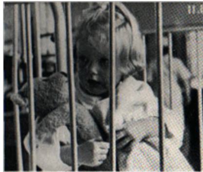
Figura 2: "A Two Year Goes to the Hospital"

Fonte: ROBERTSON, James. A two year-old goes to hospital. [S.l.: s.n], 1952. Disponível em: < http://www.robertsonfilms.info/ >. Acesso em: 12 maio 2011.