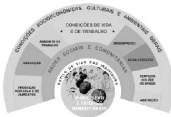
Figura 1 – Modelo de Dahlgren e Whitehead: influência em camadas

Fonte: Whitehead & Dahlgren apud Brasil, 2006.