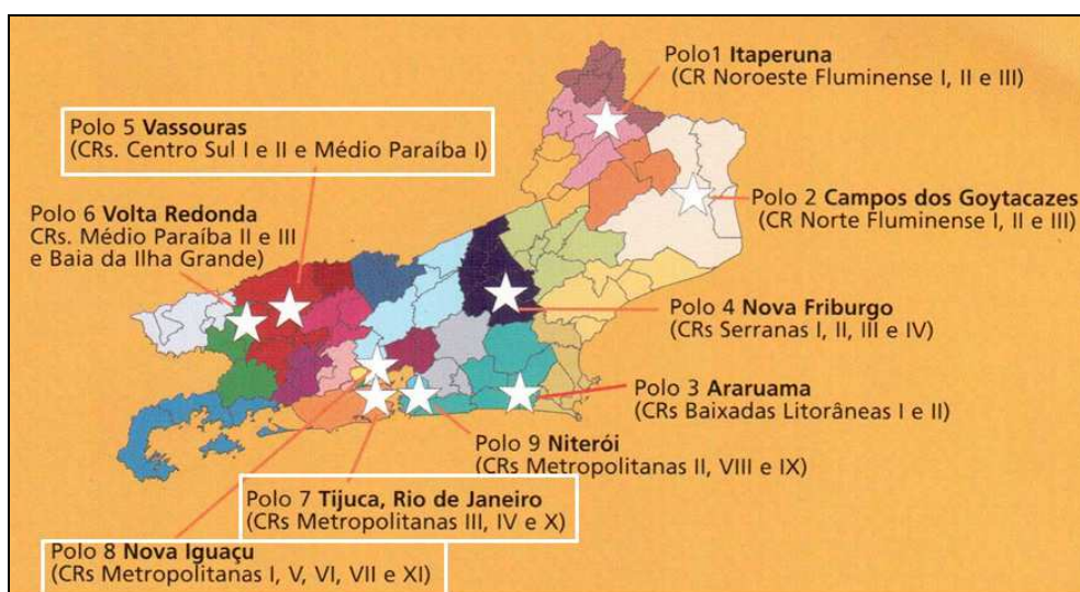
Figura 2.1 – Localização geográfica do estudo.

O processo de definição do universo deste estudo iniciou-se pelo levantamento de informações oficiais disponíveis ao domínio público no Censo Escolar realizado no ano de 2006 pela SEEDUC-RJ. Frente à diversidade de contextos sociais e a importância da região metropolitana na dinâmica da epidemia de HIV/AIDS, dentre os diversos municípios do Estado do Rio de Janeiro, foram selecionados para desenvolvimento deste estudo os jovens multiplicadores do Programa de Prevenção, moradores de municípios que fazem parte dos Polo 5 (Barra do Piraí), do Polo 7 (Rio de Janeiro) e do Polo 8 (Belford Roxo, Duque de Caxias, Mesquita, Nova Iguaçu e São João de Meriti), conforme indicado na Figura 2.1.