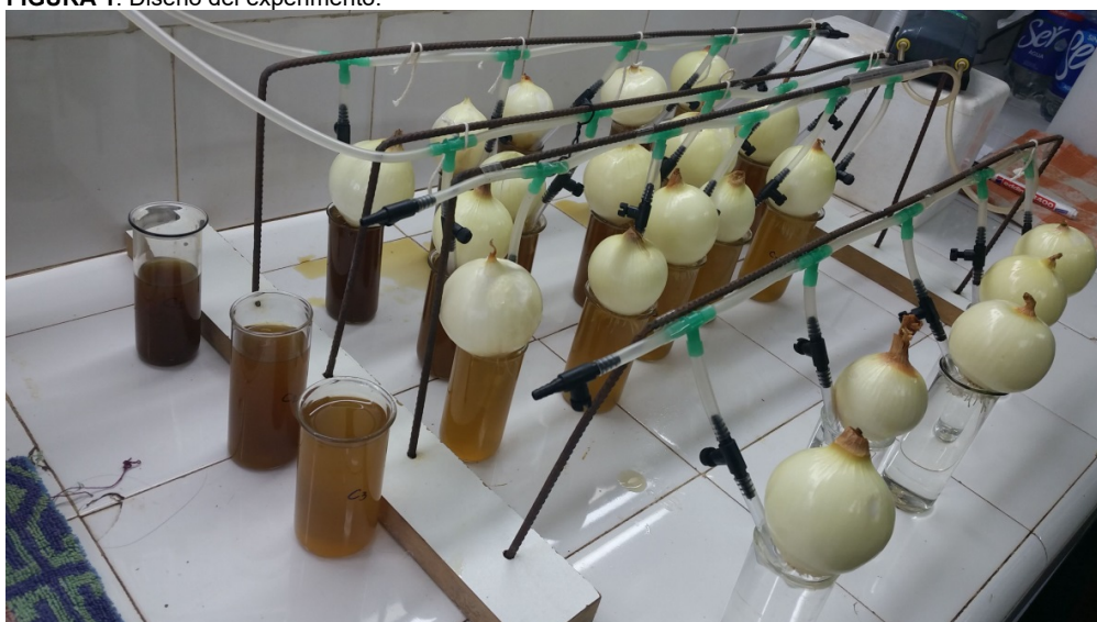
FIGURA 1: Diseño del experimento.

Las distintas concentraciones probadas y el agua mineral baja en sodio fueron reemplazadas cada 24 hs. Los extractos de M. oleifera se prepararon al momento de ser utilizados por medio de infusiones, utilizando también agua mineral baja en sodio.