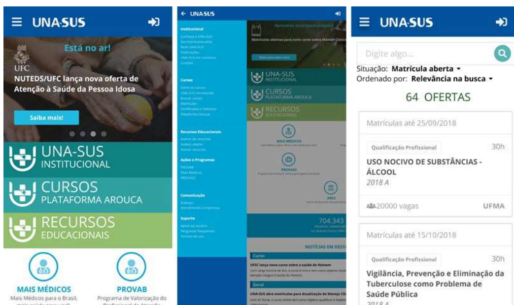
Figura 5 – Acesso ao portal UNA-SUS em celular

Os conteúdos do portal já estão adaptados para acesso por meio de dispositivos móveis, sem perda de configurações. Os smartphones , por exemplo, são responsáveis por 29,3% das visitas ao site , segundo a coleta de dados da SE/UNA-SUS, utilizando o software Matomo (MATOMO, 2018).