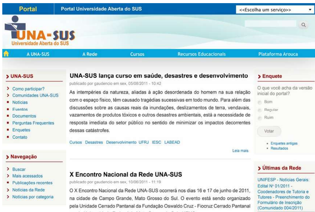
Figura 1 – Primeiro portal UNA-SUS, ainda utilizando a primeira marca

Ainda muito incipiente e com layout baseado na primeira identidade visual da UNA-SUS, a atuação daquele site era limitada principalmente a notícias do próprio Sistema UNA-SUS ou replicadas de outros setores da Saúde. Com a adesão de novas responsabilidades perante o Ministério da Saúde, como a oferta de especializações para o Programa Mais Médicos e de cursos autoinstrucionais para o Programa de Valorização do Profissional da Atenção Básica (PROVAB), o Sistema UNA-SUS cresceu e ganhou maior visibilidade. Dessa forma, tornou-se necessário reformular o portal para atender às novas demandas advindas dos referidos programas, bem como repensar a marca do Sistema UNA-SUS.