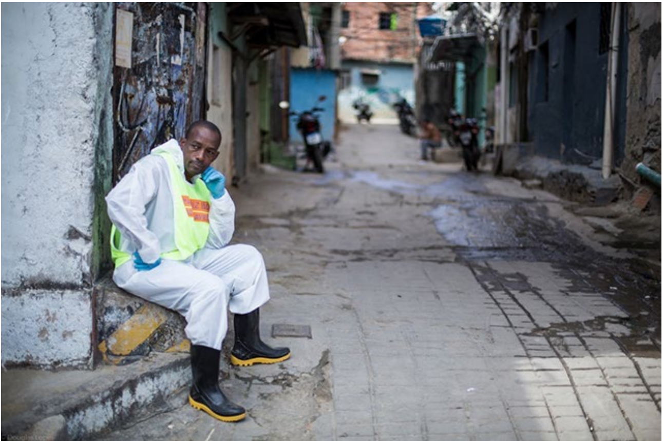
Trabalho realizado pelas ruas da Maré pelo projeto "Maré diz não ao coronavírus".