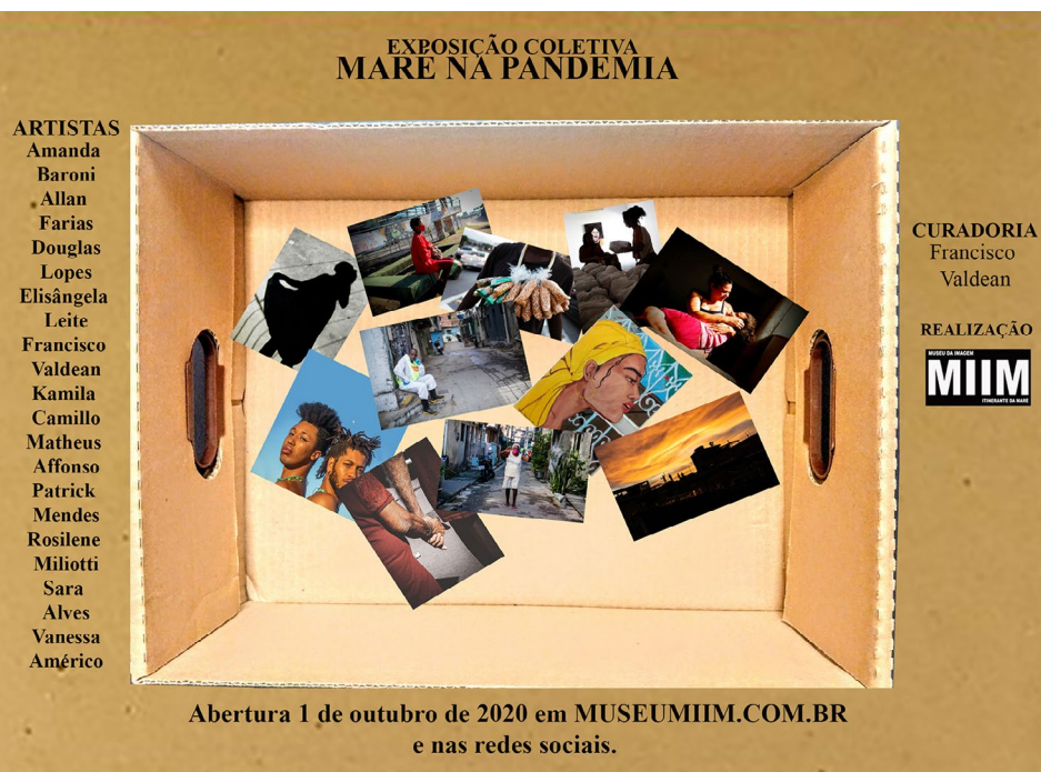
Imagem: arte de divulgação

A exposição entrou no ar em 1º de outubro de 2020, no site do Museu MIIM, a ação artística é fruto de dois movimentos: o primeiro, uma convocatória no formato de chamada pública “Histórias da