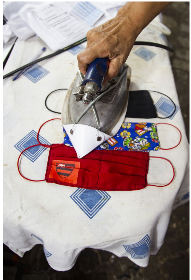
As máscaras passaram a ser uma fonte importante de renda para muitos moradores.