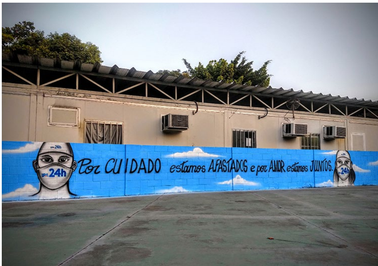
Muro do UPA 24 horas da Maré alerta com um grafite a importância dos cuidados, o afastamento social é uma importante atitude de proteção contra o vírus.