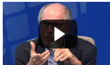
Reinaldo Guimarães Desafios Globais na Pesquisa em Saúde