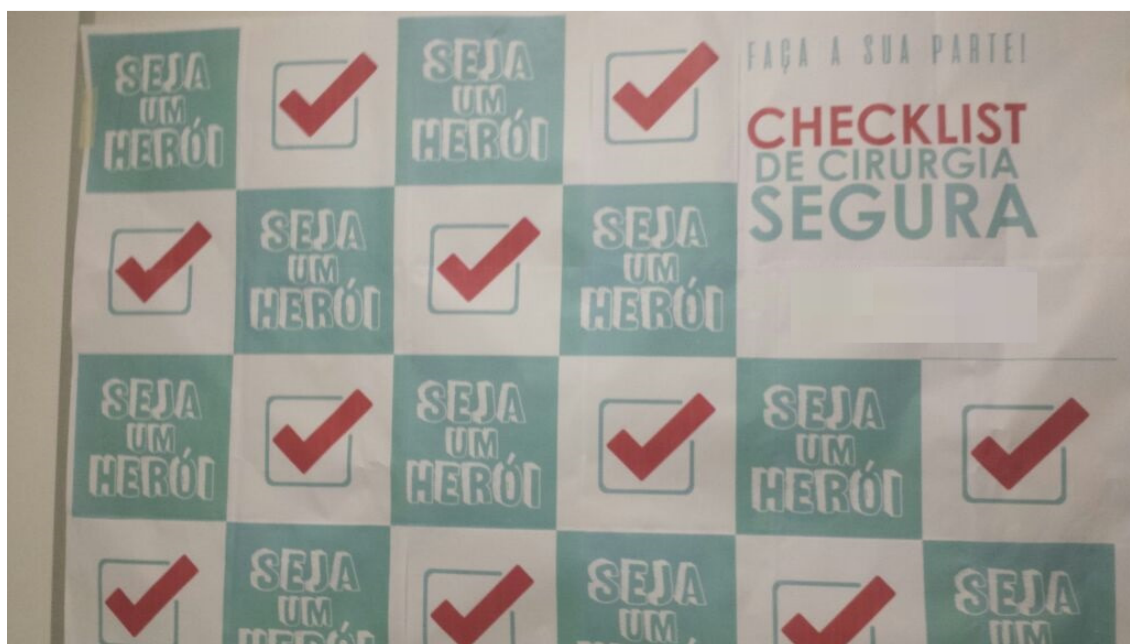
Figura 3: Campanha Seja um Herói, Hospital Renovação, 2017.

Entre tais estratégias, sublinha-se a campanha “Seja um herói”, valorizando a adesão ao checklist de cirurgia segura, demonstrando que sua adesão pode salvar vidas. Através da divulgação, nas mídias internas do hospital, de fotos dos profissionais de saúde junto a um banner com o símbolo de verificação (☑) (Figura 3).