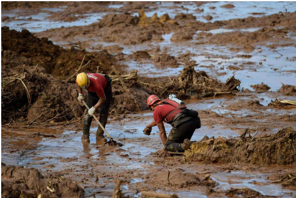
Figura 4: Bombeiros buscando por vítimas em meio ao rejeito

Em certos momentos os bombeiros precisavam se deslocar na lama que não estava em um estado totalmente sólido, além de representar um risco para esses profissionais pela possibilidade de contaminação, também significava um grande esforço físico. Uma estratégia utilizada foi a utilização de tapumes de madeira que eram colocados em pontos estratégicos para facilitar a locomoção desses profissionais permitindo o acesso a locais de risco.