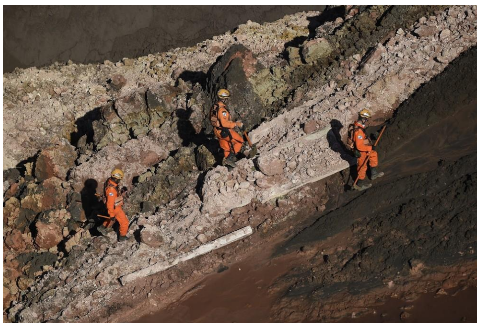
Figura 8: Bombeiros procurando por corpos na região do Córrego do Feijão

duas semanas depois, durante duas semanas após o meu retorno e eu achando que era cansaço até que chegou em um ponto que a direita já não tava sentindo mais nada só que a esquerda fica como, não sei se você já sentiu estiramento de músculo, parece que tá rasgando. Então toda vez que eu punha o pé no chão eu comecei a sentir isso. Eu já não tinha mais o formigamento né mas eu fui sentir esse desconforto na sola do pé. Depois fazendo uns exames foi identificado a questão. É uma inflamação que dá nessa fásia né, nessa membrana que tem entre a pele. [...] eu não posso fazer atividade física né, eu não posso correr porque pode agravar pode lesionar mais ainda, agravar mais ainda a situação, então eu fui suspenso de atividades físicas. Como eu já apresentei um determinado problema, então eu não fui empenhado novamente pra operação na parte de campo.” (Ten. G. – 118 dias de atuação, MG).