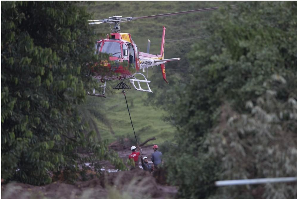
Figura 3: Bombeiros preparando para suspender corpo encontrado na lama