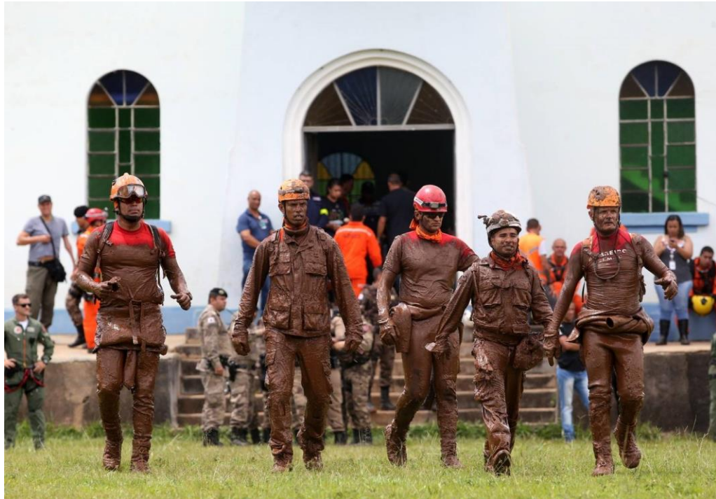
Figura 7: Bombeiros cobertos de lama de rejeito