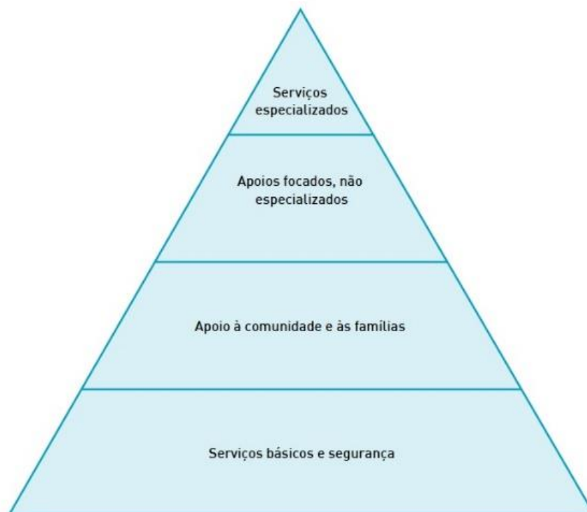
Figura 1. Intervention pyramid for mental health and psychosocial support in emergencies.

Essas pessoas, vítimas de um desastre, são afetadas de formas diferentes e necessitam de tipos de apoio diferentes. Acerca disso IASC (2007), um grupo formado por líderes das maiores organizações humanitárias que atuam em situações de desastre, desenvolveu um sistema em níveis de apoios complementares com a finalidade de atender as diferentes necessidades de diferentes vítimas. Esse sistema está representado na ilustração de uma pirâmide (figura 1) e todos os seus níveis devem ser implementados simultaneamente.