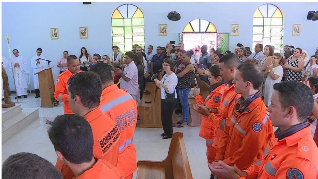
Figura 6: Bombeiros participam de missa no Córrego do Feijão

Os demais setores atuantes na operação trouxeram a esses profissionais uma troca de saberes e harmonia na busca por melhores formas de pensar a operação e seu sucesso. Com os atingidos pelo rompimento da barragem não foi diferente, onde apareceu mais questões voltadas a motivação com agradecimentos, sorrisos, aplausos, homenagens das crianças. E tiveram, também, a relação com a Vale S.A. que garantia aos bombeiros todo suporte material e de infraestrutura necessária.