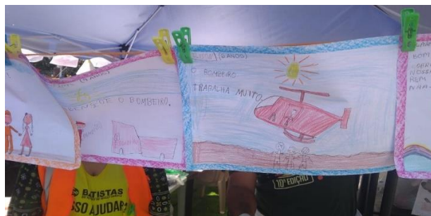
Figura 5: Crianças homenageiam bombeiros com desenhos

Os bombeiros relataram contato com crianças e ambas as experiências foram narradas com felicidade e empolgação. As homenagens realizadas por elas demonstrou ser um fator que influenciou positivamente no motivacional para o trabalho deles nesta operação.