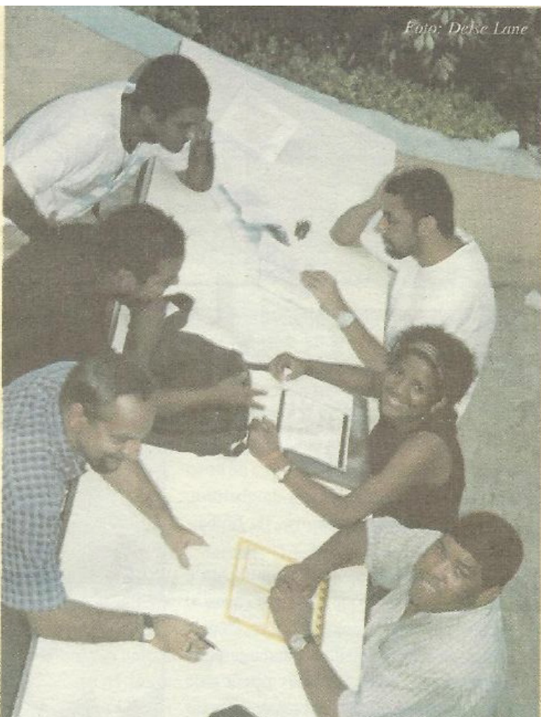
Imagem: Deise Lane

O Núcleo de Pesquisa surgiu pela primeira vez em 2001, como Núcleo de Estudo e Pesquisa do Observatório Social da Maré, chamado de Nepos. Ele foi criado a partir dos dados obtidos pelo Censo Maré, uma