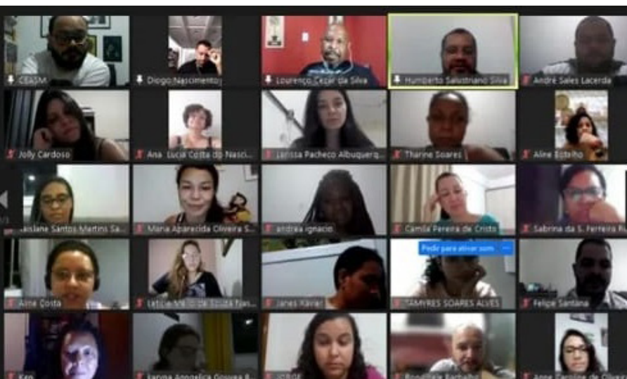
Primeira oficina de elaboração de pré-projeto de pesquisa para pós-graduação