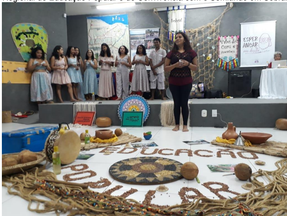
Figura 07: Imagem da apresentação da sistematização da experiência no encontro Regional de Educação Popular e de Convivência com o Semiárido em Sobral - Ceará

O teatro, a dança, a música, as poesias são reverberadas por esses corpos, que são receptíveis, que criam, reinventam, transmutam: a arte logra ligar-nos ao nosso inconsciente, nossa percepção mais profunda, mas também sem perder os elos que nos atam uns aos outros. A arte é algo que está na vida, são corpos em presença. “O ator não interpreta, ele é. Ele não expressa nada, mas simplesmente é com plenitude. A busca dessa plenitude, desse estado presente, desse ser...” (BURNIER, 2009, p .149).