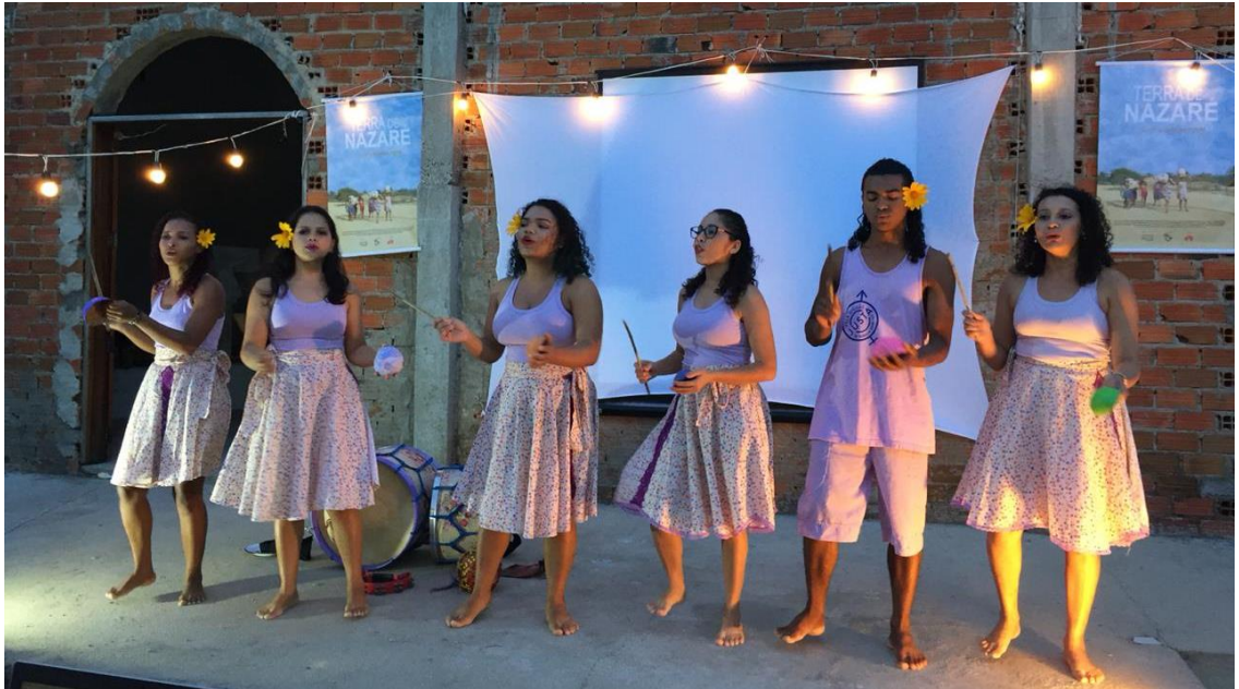
Figura 06: Imagem da apresentação “Flor no Meu Quintal” do grupo Balanço do Coqueiro , no lançamento do documentário “Terra de Nazaré” na comunidade Apiques - Assentamento Maceió – Itapipoca - Ceará

Assentamento, onde os/as jovens fizeram uma fusão do momento histórico da comunidade e a arte vivenciada por eles/as na contemporaneidade com seus tambores, ritmos, composições e poéticas, no qual propõem a luta juvenil pela Reforma Agrária e pelos direitos das mulheres.