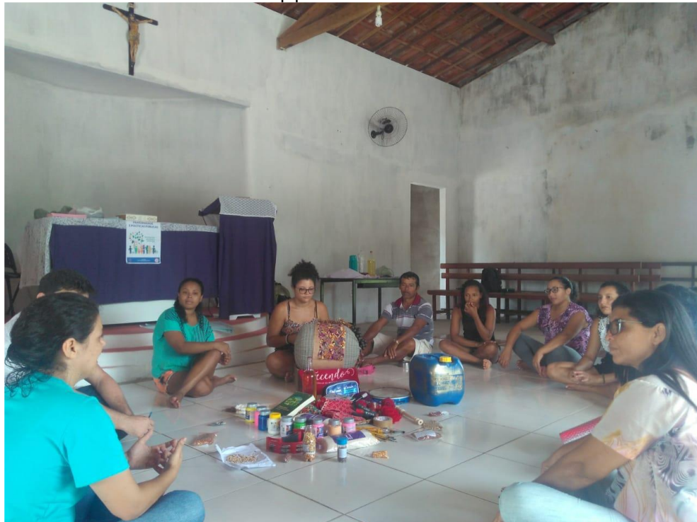
Figura 03 – Memória visual da oficina de Cartografia Social na comunidade Sítio Coqueiro – Itapipoca – Ceará