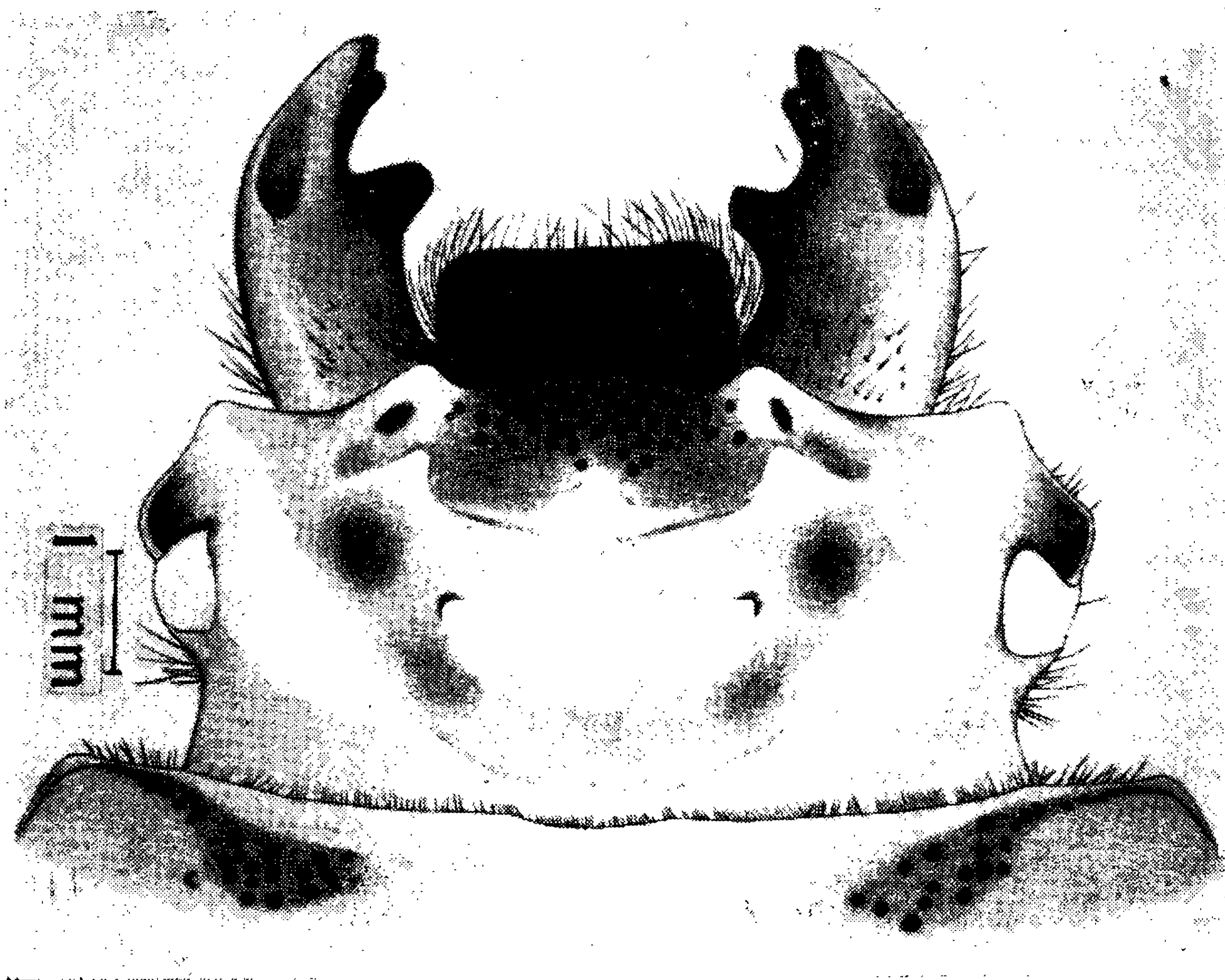
Fig. 1 — Passalus striatissimus Luederwaldt, 1934, vista dorsal da cabeça e parte do aparelho bucal. Bührnheim del.

pressão lisa, exceto pela presença de um ponto bem impresso. Ângulos anteriores com os vértices levemente arredondados.