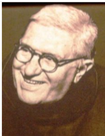
Agostino Gemelli (1878-1959)

A segunda surpresa é exatamente podermos observar sob esse novo prisma as relações entre os mundos da ciência, da política e da religião que foram tecidas tendo como ponto de interseção Agostini Gemelli. Esta é a sua centralidade: circular por esses três mundos e articular com as diferentes linhas de força sociais da época o desenvolvimento das ciências psicológicas a partir de certos espaços institucionais e de correntes teóricas específicas, e não de outras. Assim, por exemplo, Agostini constrói no contexto italiano do entreguerras uma relação complexa com a psicanálise freudiana: atacando-a como difusora de uma visão de mundo perigosa para a ordem social católica e sob a égide do fascismo, ao mesmo tempo que a defende pelo conhecimento