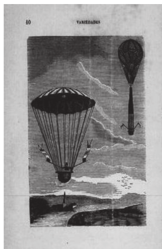
Figura 1: Aeróstato em Sciencia para o Povo.

Os temas, assim, versavam sobre os mais diferentes aspectos da vida, observáveis por qualquer um: água, noites luminosas, atmosfera, bom e mau tempo, pedras preciosas, ação do calor sobre o colorido das flores, decomposição dos raios luminosos, meio de reparar o aço dos espelhos, fogo. Para completar esse acesso mais direto pela observação das coisas, a visibilidade era um elemento importante, e desde os primeiros números Ferreira buscou anunciar o acompanhamento de estampas em suas edições. Nos primeiros números, o intuito de trazer ao público os desenhos das principais obras traduzidas era anunciado, levando às suas páginas imagens como a de um aeróstato (Figura 1). A imagem do balão, símbolo das maravilhas científicas, representava os clichês ligados aos vulgarizadores muito presentes nas publicações francesas.