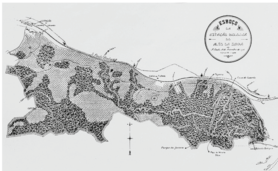
Figura 3: Planta da Estação Biológica do Alto da Serra, 1924 (Hoehne, 1925, p.88)

Os nomes dos caminhos de acesso são homenagens aos homens ligados às ciências e à política, com destaque para o cenário político paulista. As escolhas foram assim justificadas: