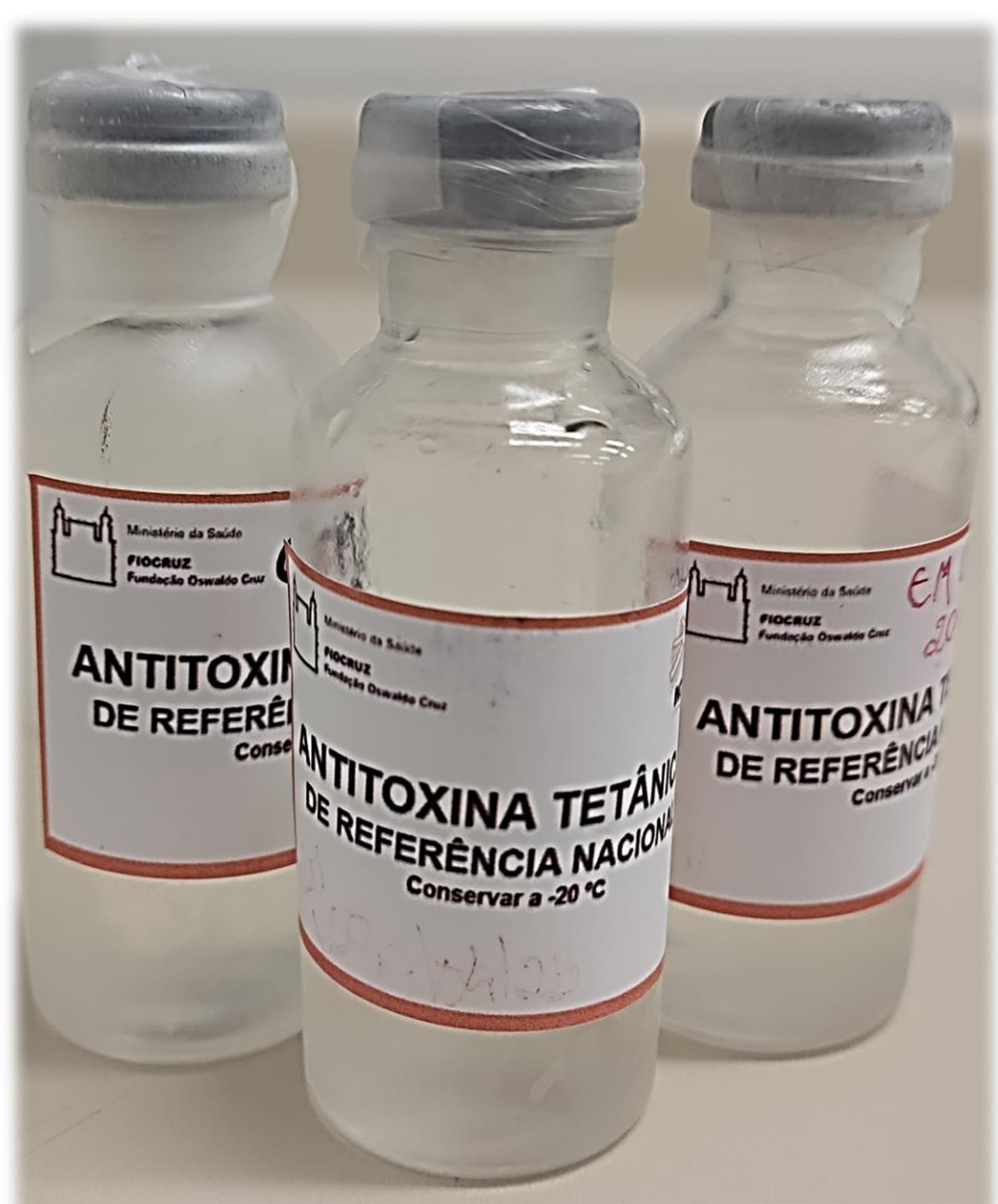
Figura 1. Padrão de Referência