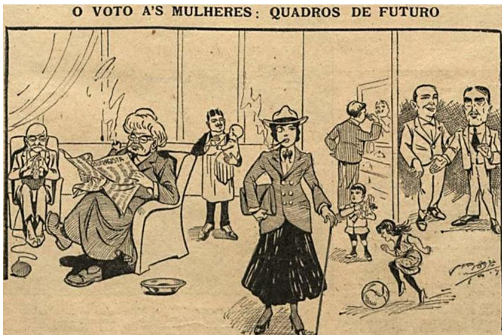
Figura 1: O Malho, 1917 in Biblioteca Nacional Digital

Além do voto, todos os direitos das mulheres são muito recentes. Por 350 anos o Brasil esteve sob um ordenamento jurídico conhecido como Ordenações Filipinas. Além do fato já comentado de que a mulher era considerada incapaz, devendo ser representada na vida civil pelo pai ou marido, essas duas figuras também tinham por direito disciplinar com castigos físicos, exercidos com pau e pedra. Também era legítimo, segundo esse ordenamento jurídico,