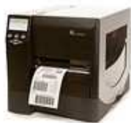
Figura 3 - Impressora de etiquetas passivas RFID

Para impressão das etiquetas inteligentes, será necessária a aquisição de impressoras com a funcionalidade de impressão de etiquetas RFID passivas semelhantes às usadas para impressão de etiquetas na instituição, o que facilitará seu uso na instituição.