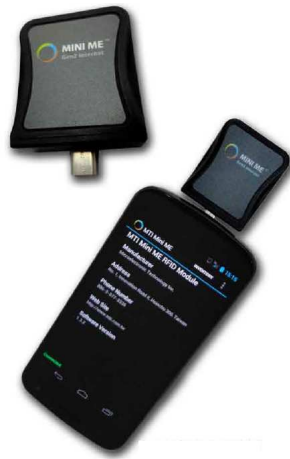
Figura 7 - Leitor RFID integrado a Smartphone / Tablet com Android