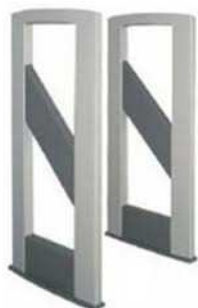
Figura 9 - Antena porta

magnético. Os leitores também têm antenas que são utilizadas para emitir ondas de rádio. A energia de radiofrequência da antena do leitor é captada pela antena e utilizada para ligar o microchip, que muda a carga elétrica na antena para refletir seus próprios sinais.