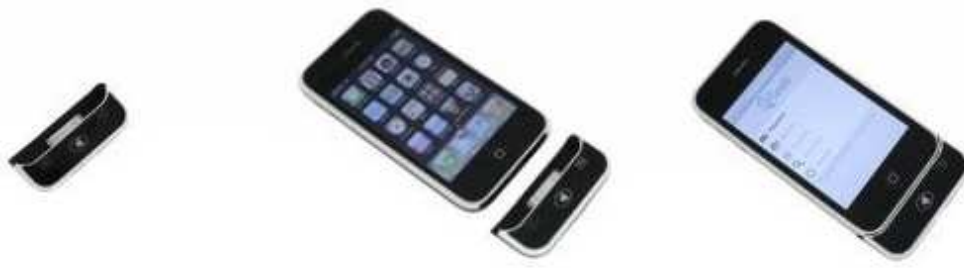
Figura 6 - Leitor RFID integrado ao iPhone/iPod