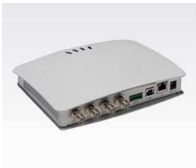
Figura 8 - Leitor fixo RFID