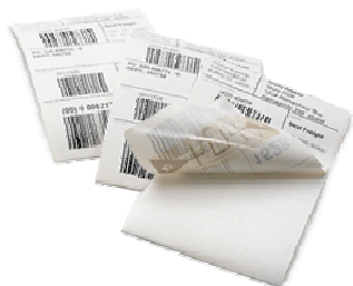
Figura 2 - Etiqueta passiva

Para impressão das etiquetas inteligentes, será necessária a aquisição de impressoras com a funcionalidade de impressão de etiquetas RFID passivas semelhantes às usadas para impressão de etiquetas na instituição, o que facilitará seu uso na instituição.