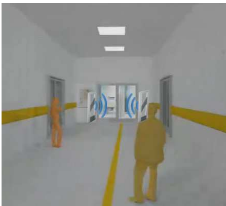
Figura 12 - Funcionamento antena rastreamento localização