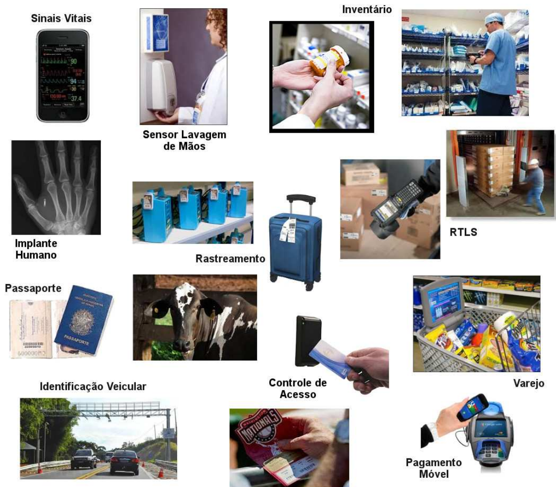
Figura 1 - Aplicações RFID