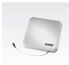
Figura 10 - Antena RFID