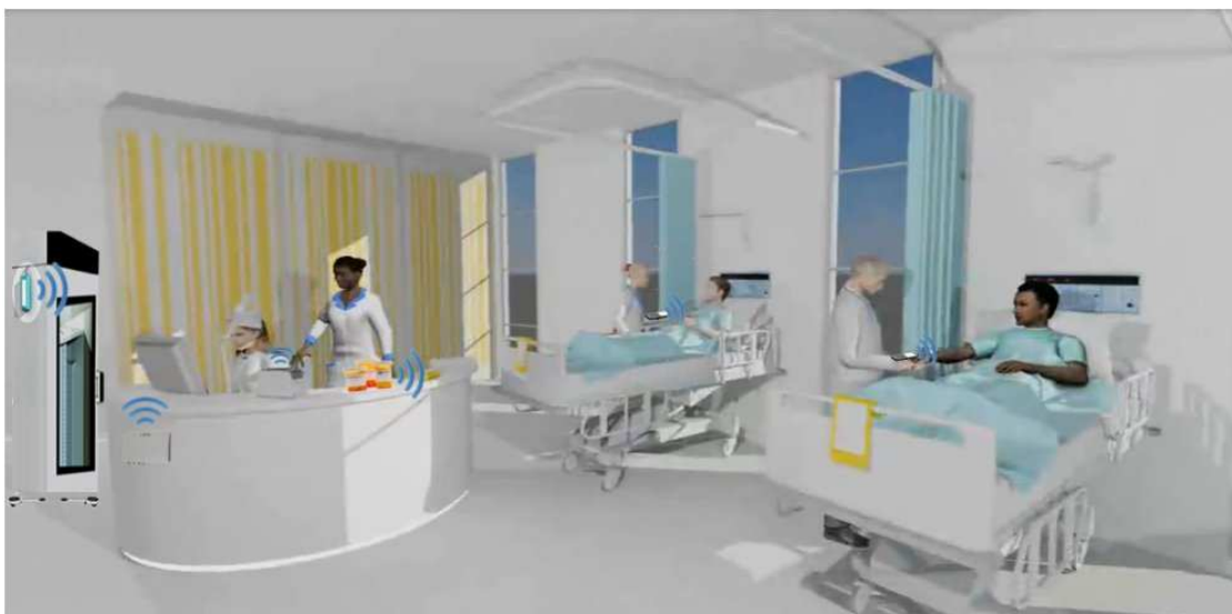
Figura 11 - Funcionamento proposto HCPA