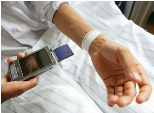
Figura 5 - Leitor Móvel RFID

O leitor é um dispositivo usado para se comunicar com as etiquetas RFID. O leitor tem uma ou mais antenas, que emitem ondas de rádio e recebem sinais de volta da etiqueta.