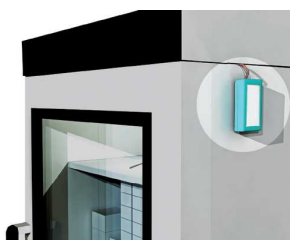
Figura 4 - Etiqueta ativa com sensor térmico